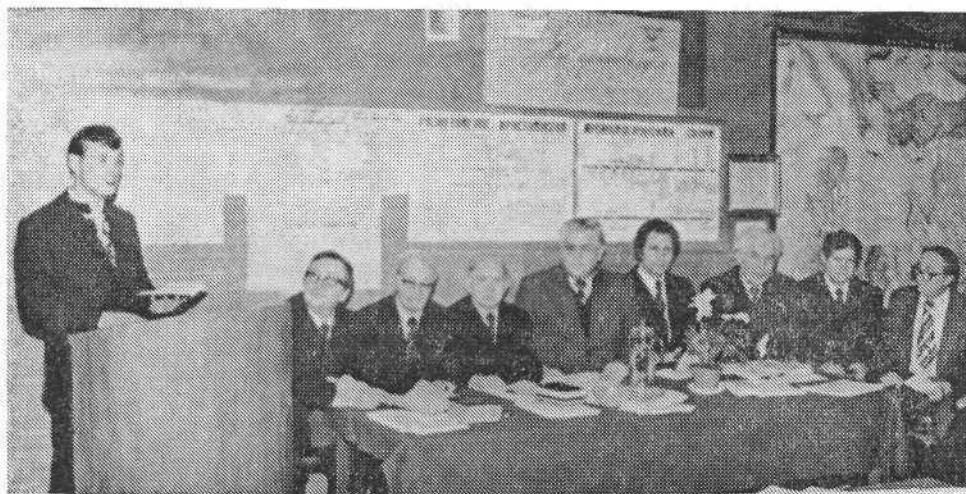
Сдача экзаменов на Библейских курсах.