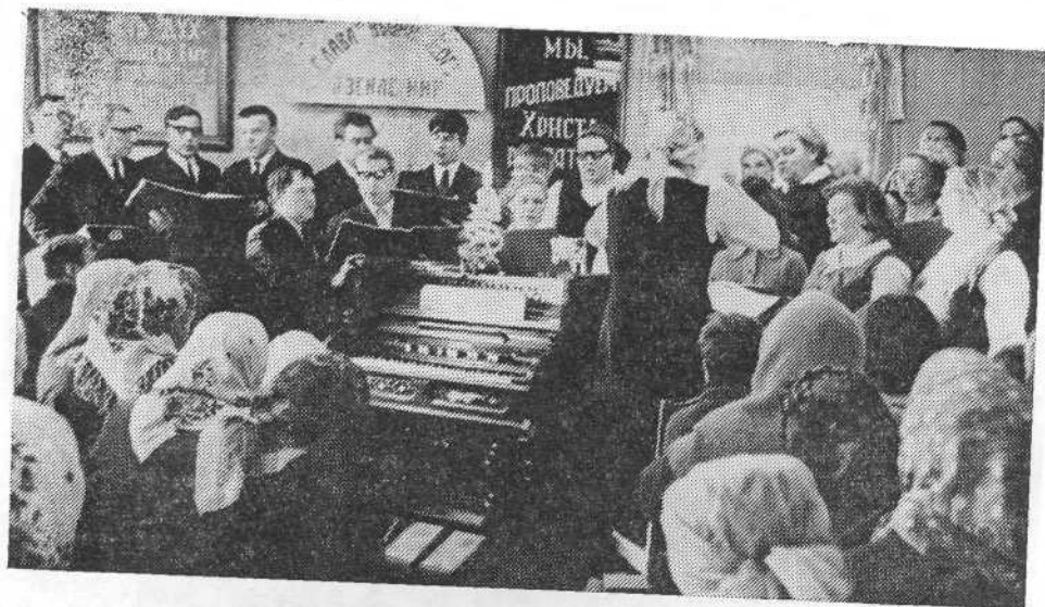
Богослужение в церкви г. Вышний Волочек.