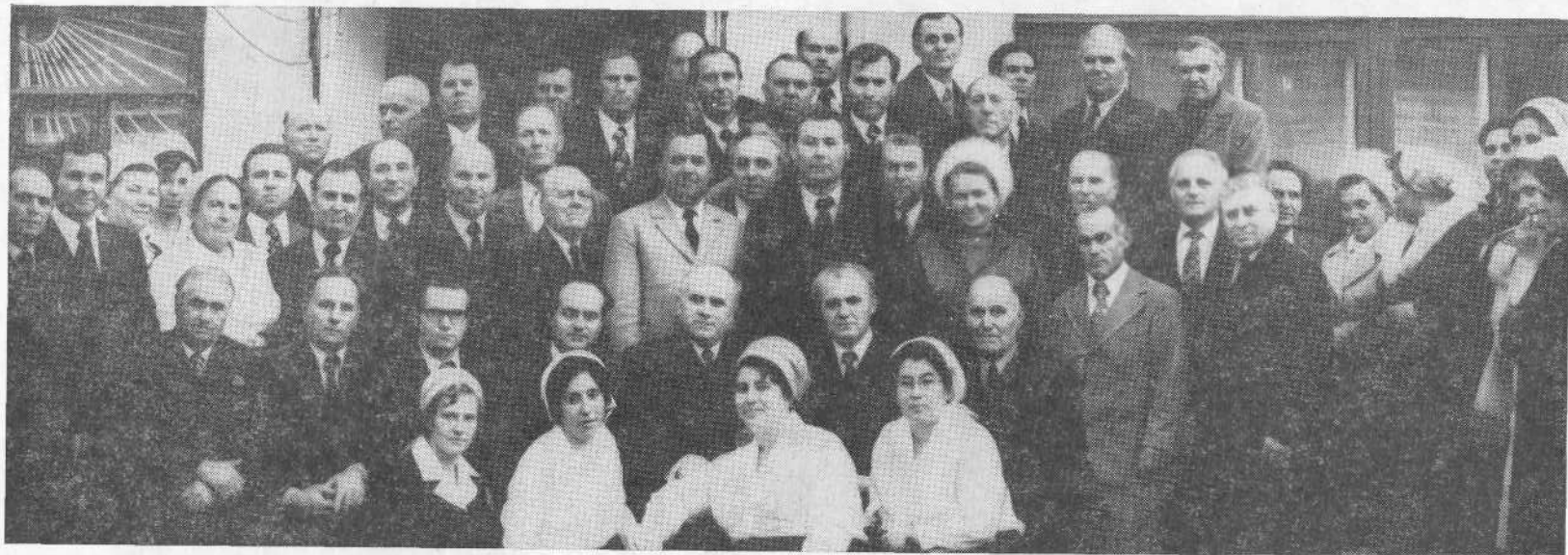
Верующие Николаевской церкви.