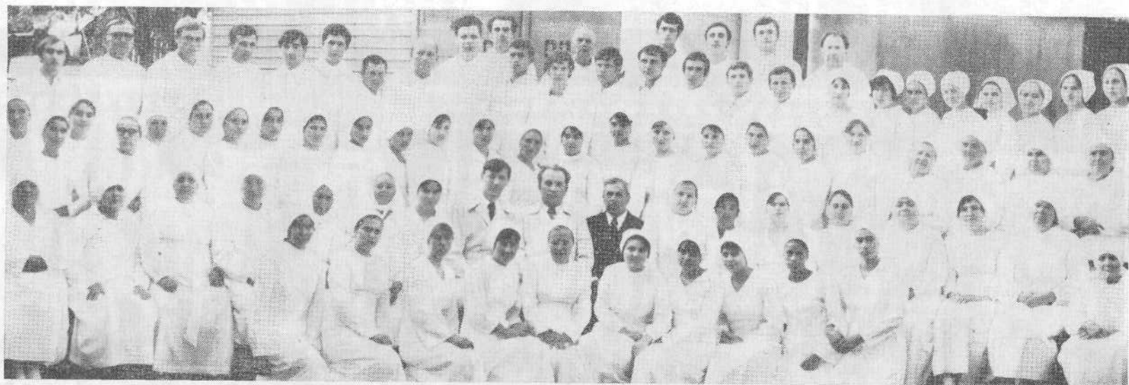
Новые члены Кишиневской церкви.