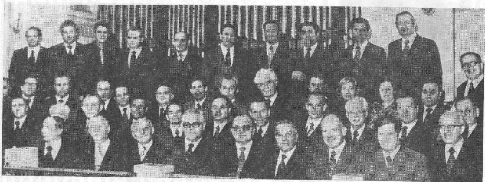
Участники семинара представителей церквей соц. стран.