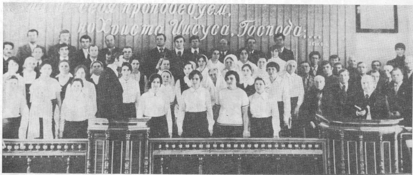
Хор церкви г. Тирасполя.