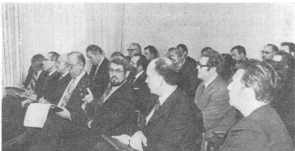
Заседание семинара представителей церквей соц. стран.

Все выразили свое удовлетворение работой семинара-консультации и указывали на необходимость проведения таких встреч в будущем, и было высказано пожелание, чтобы представленные семинару основные доклады были направлены в рабочие комиссии ВСБ для ознакомления.