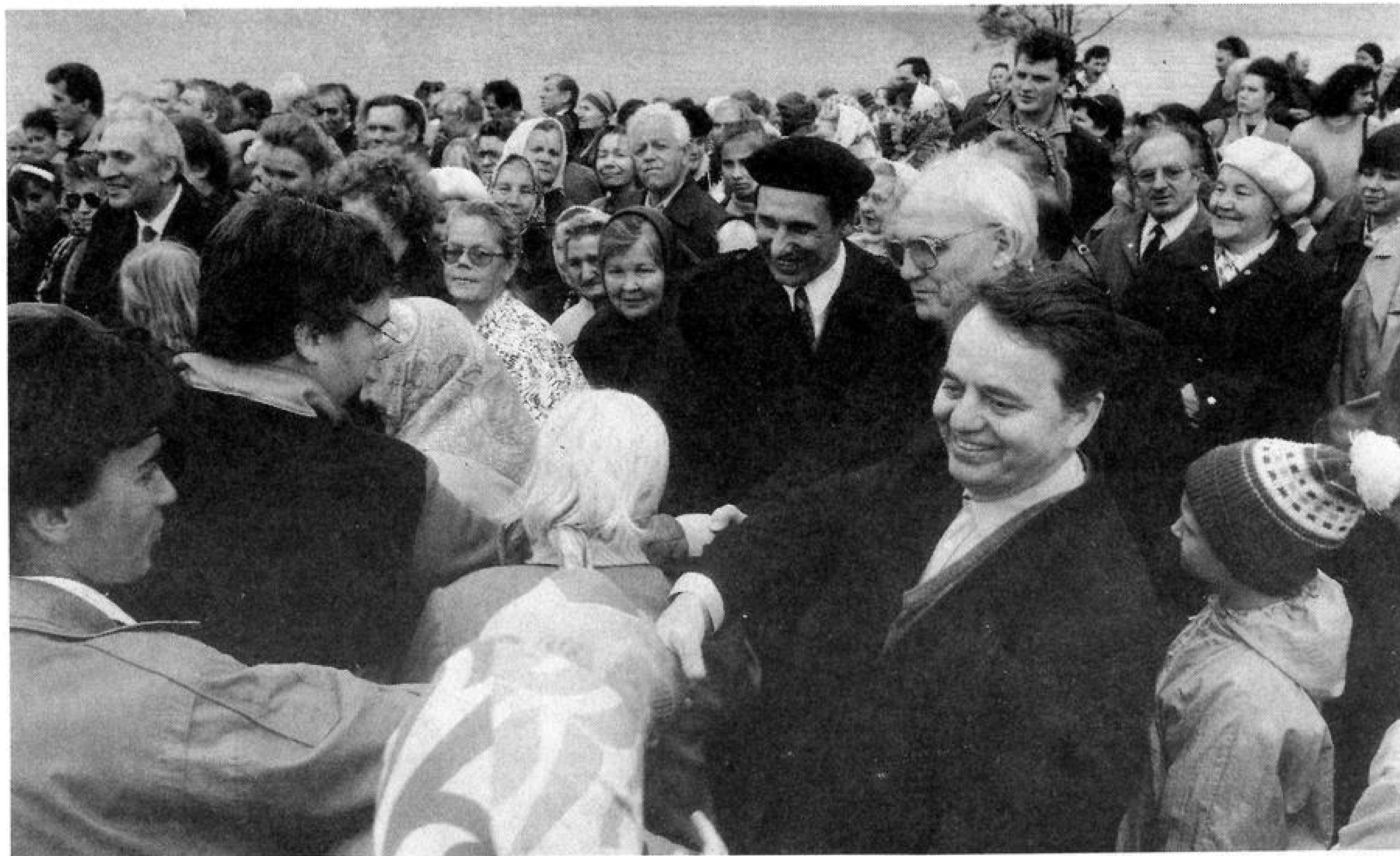
Служители поздравляют братьев и сестер, вступивших в завет с Господом через святое водное крещение