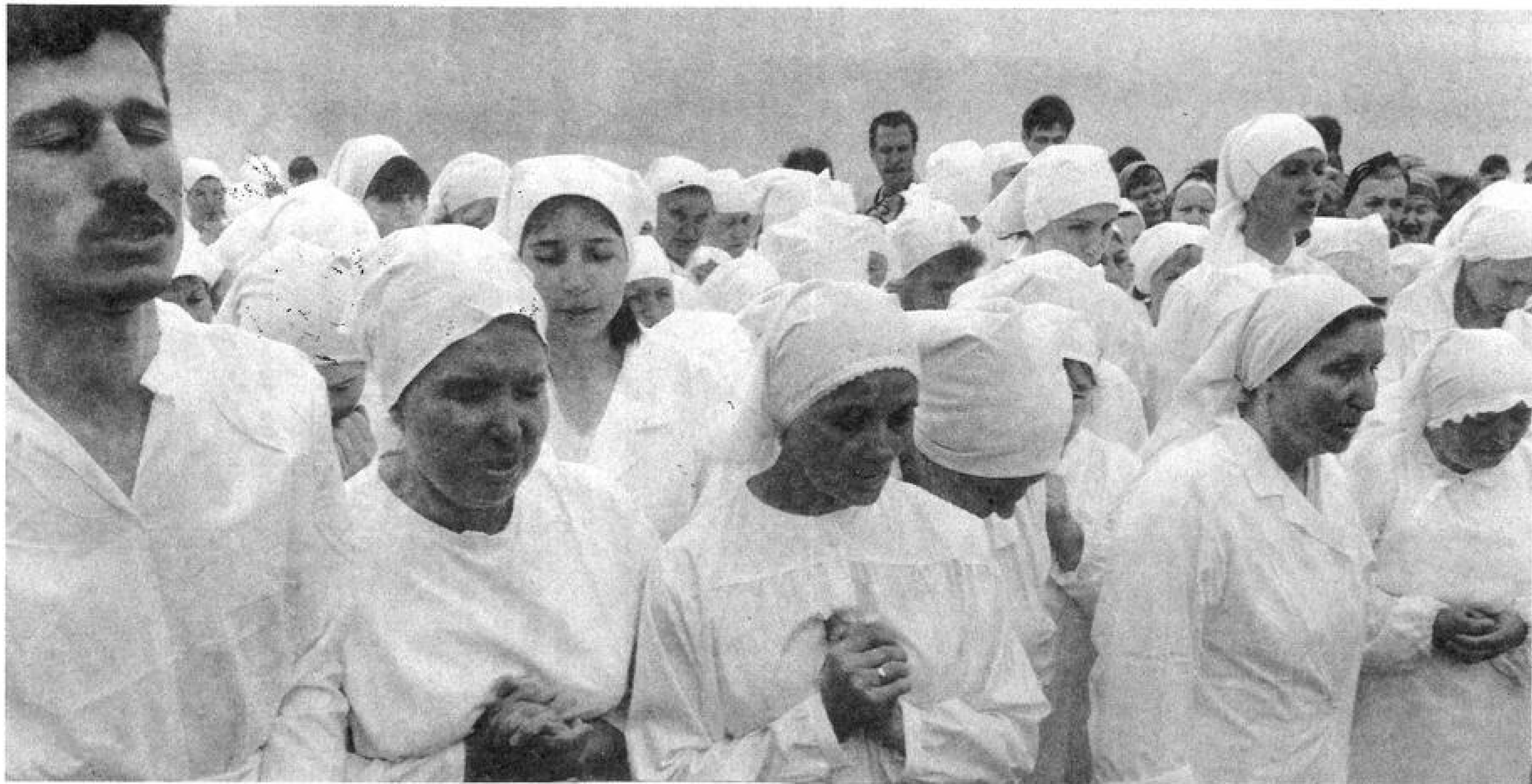
Перед крещением новых членов Центральной церкви города Москвы