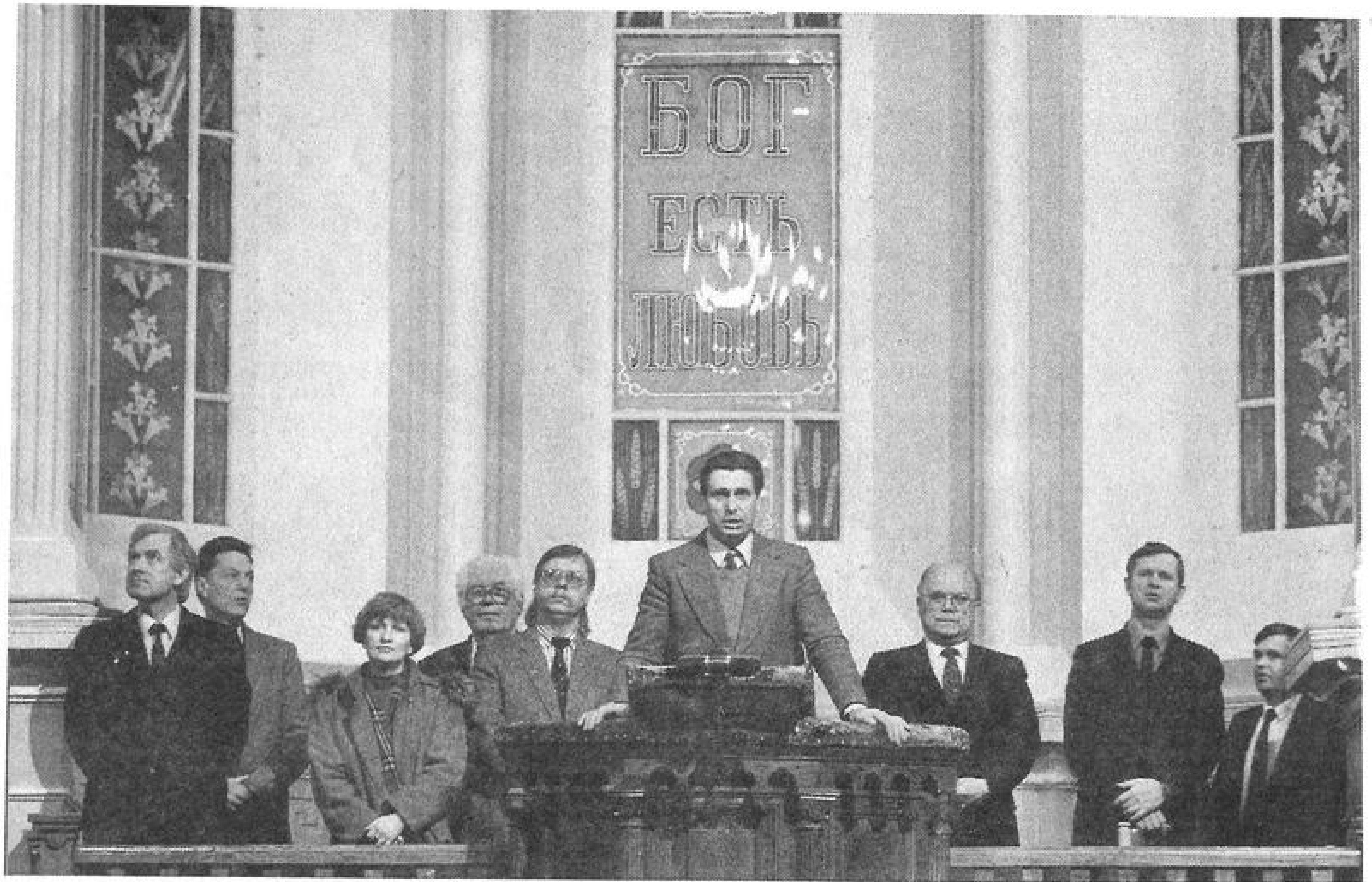
Богослужение в Московской церкви