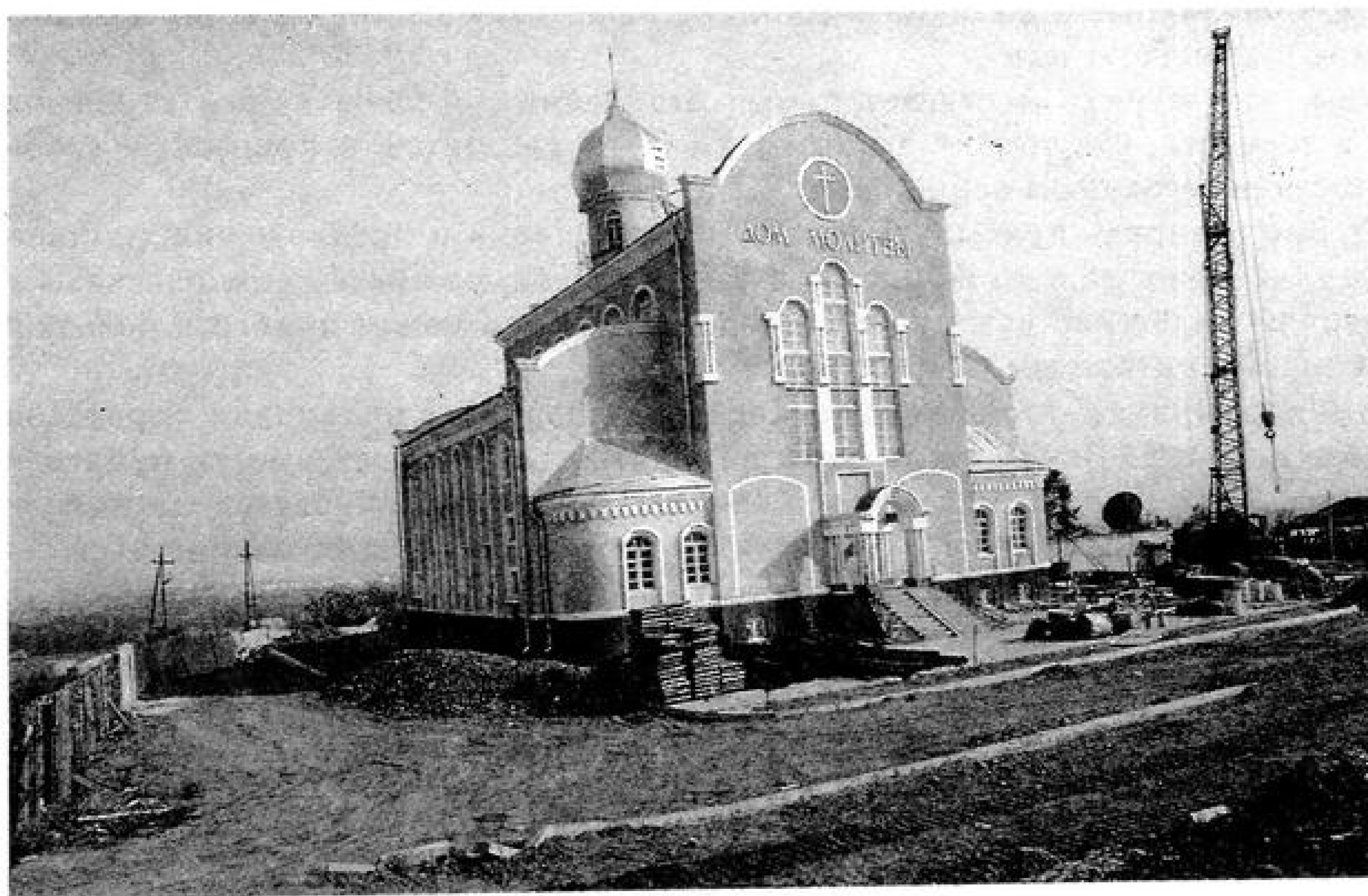
Новый молитвенный дом Красноярской церкви