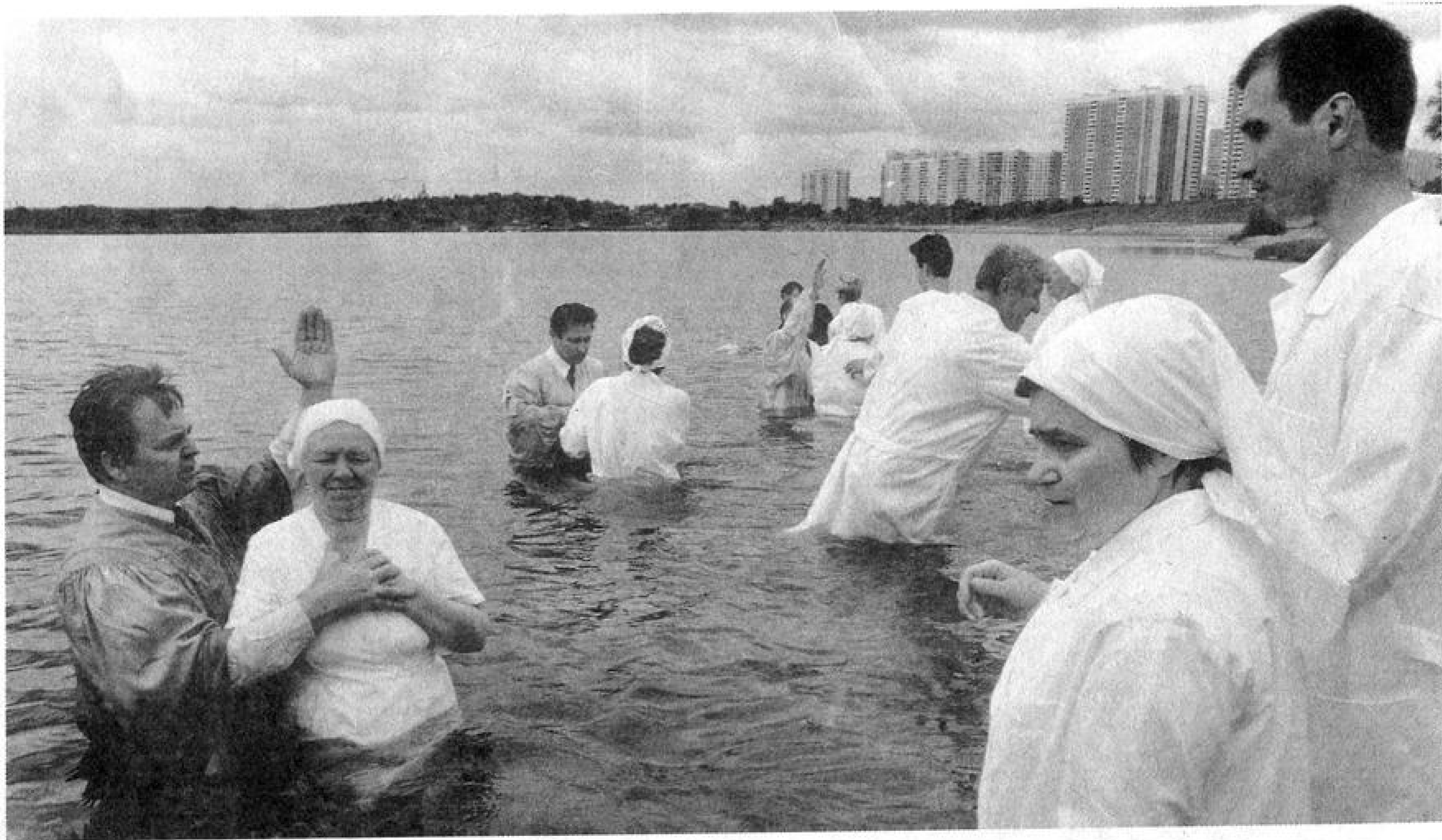
Крещение по вере