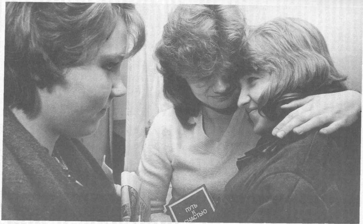
Общение в женской колонии.