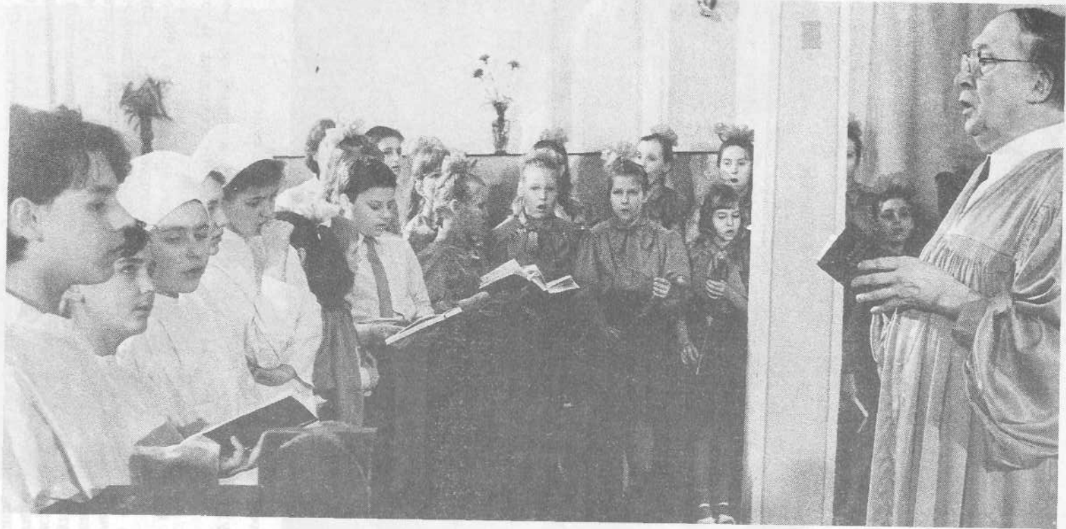
Перед крещением новых членов Московской церкви.