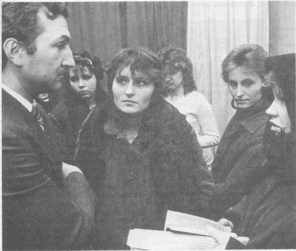
Беседа в женской колонии в городе Можайске.

нас, независимо от того, кто мы, и что совершили в прошлом.