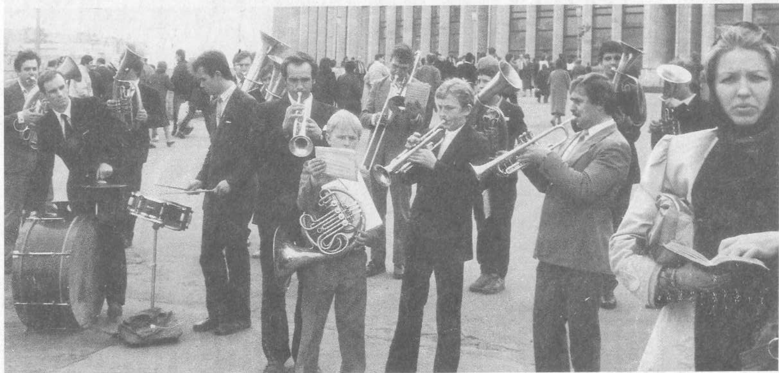
Духовой оркестр исполняет христианские гимны.