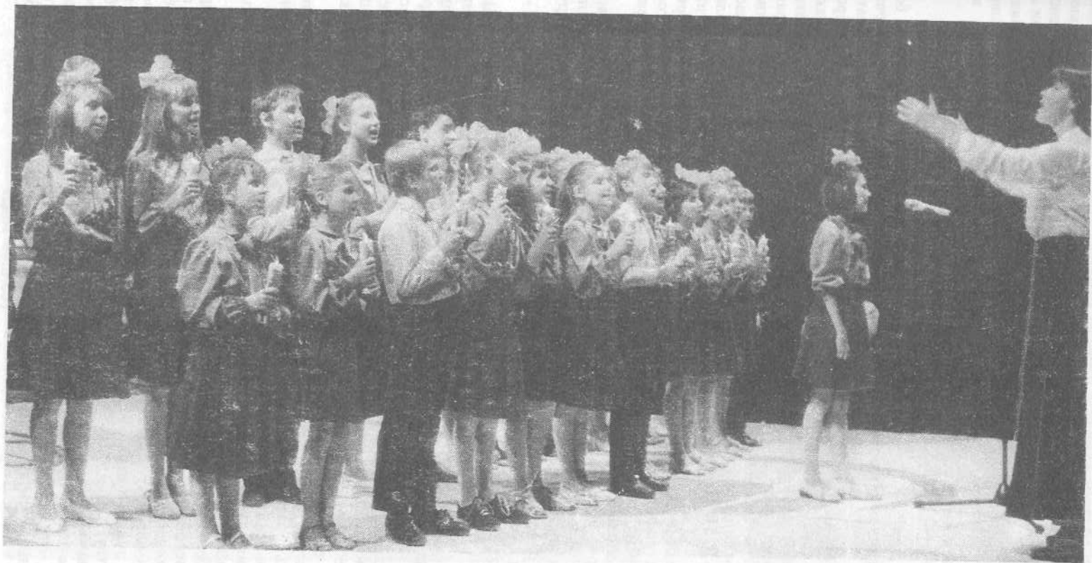
Хор подростков Московской церкви поет во славу Господа на евангелизационном служении