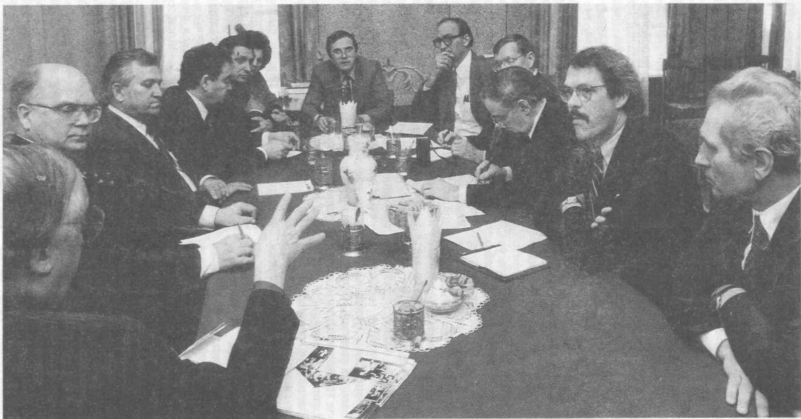
Гости из Соединенных Штатов в канцелярии Союза евангельских христиан-баптистов.