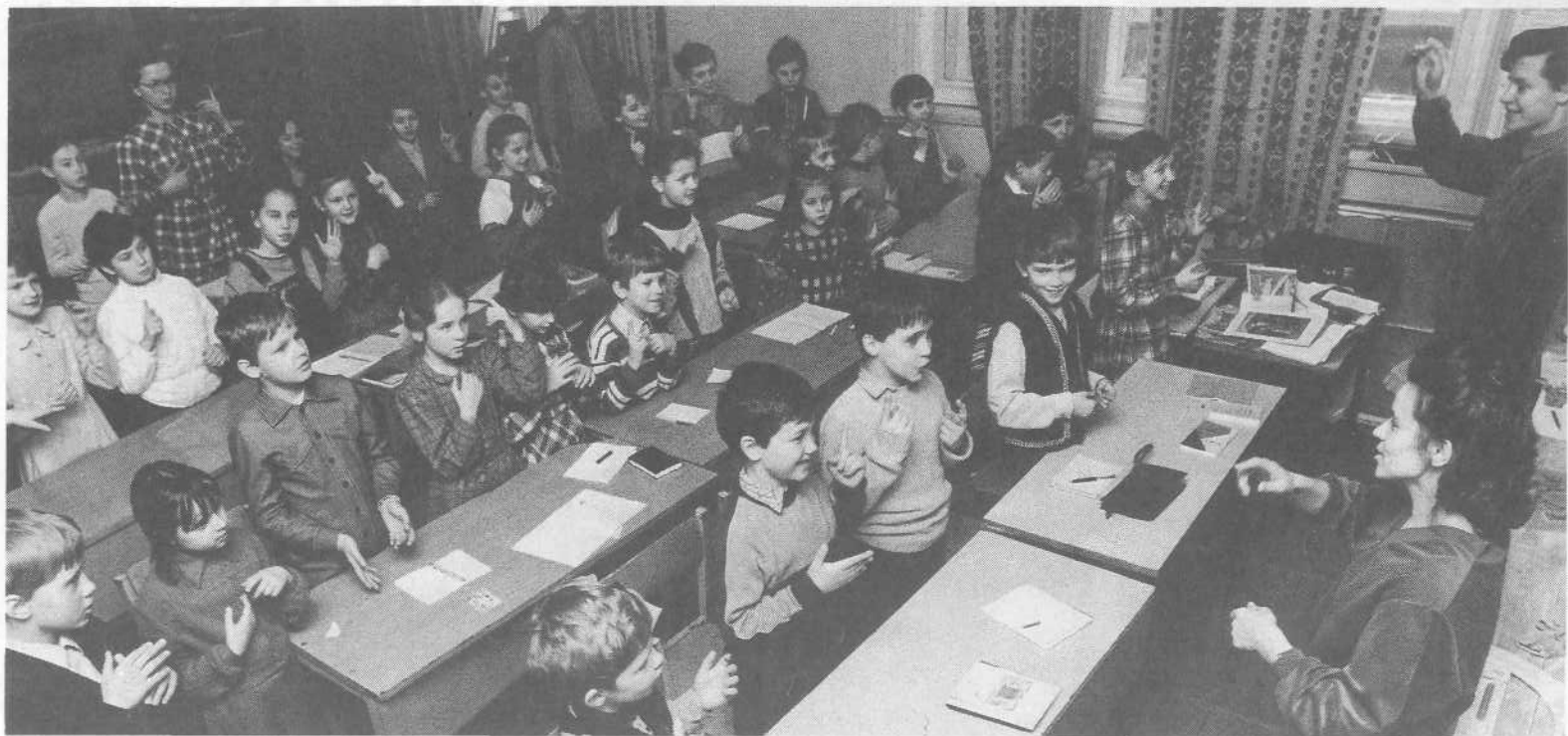
Занятия в воскресной школе при церкви города Москвы.