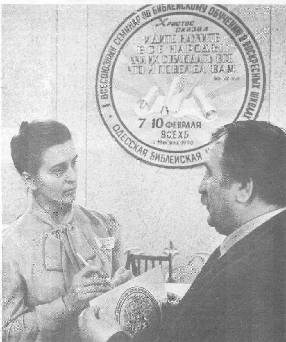
В перерыве между занятиями преподавателей воскресных школ.