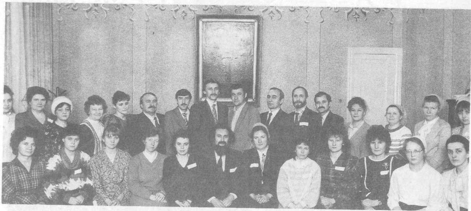
Участники семинара преподавателей воскресных школ. Москва, февраль 1990 года.