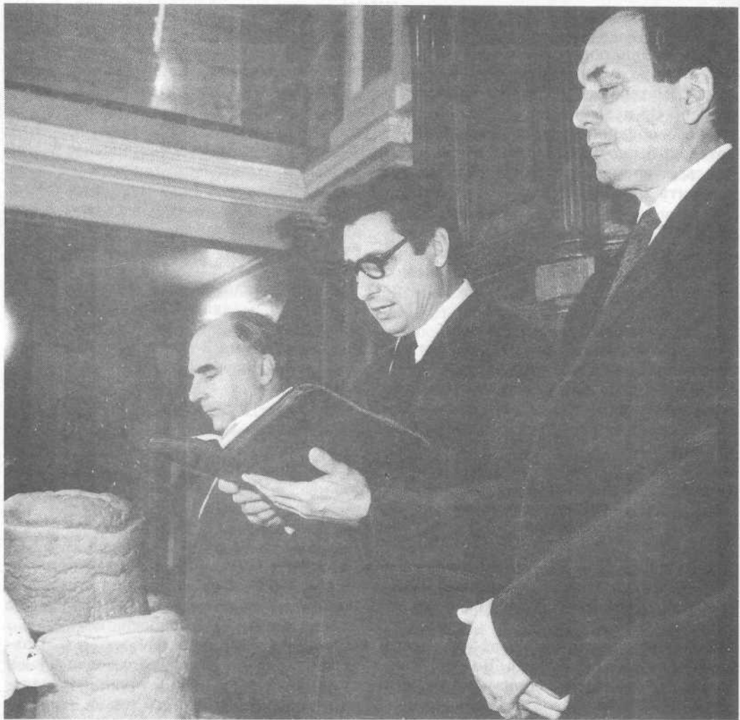
Хлебопреломление в Московской церкви.