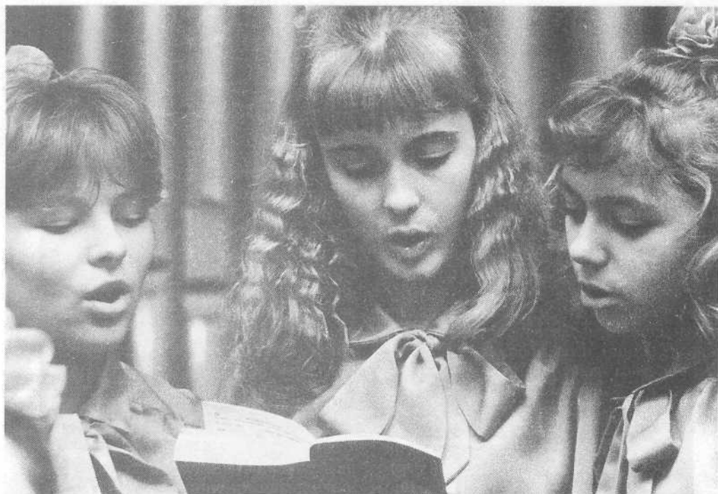
Группа юных сестер на богослужении в Московской церкви.