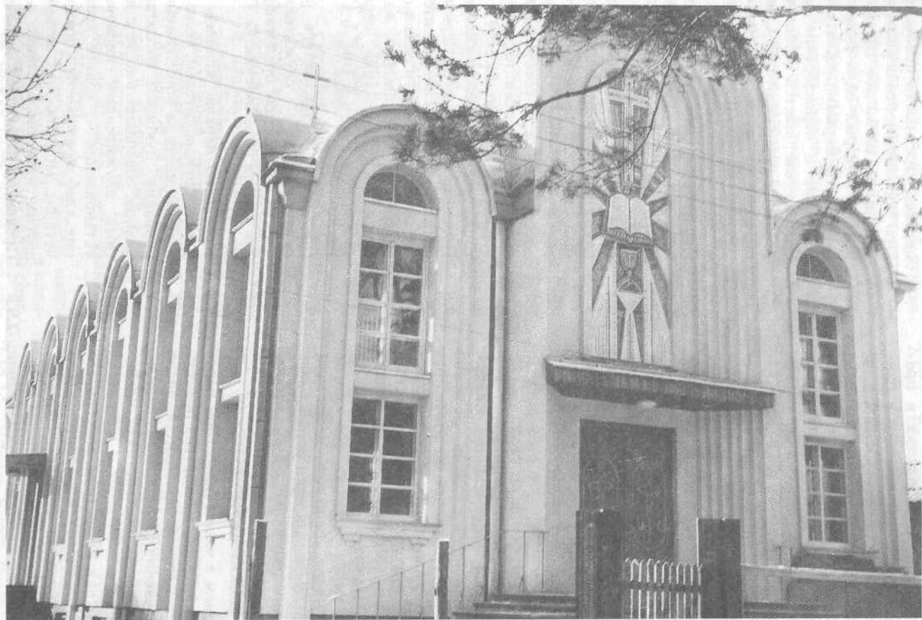
Новый молитвенный дом церкви города Черкассы.