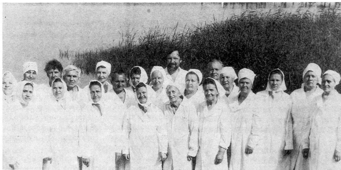
Крещаемые церкви поселка Приволжский Саратовской области

Когда их прочитал, то мое сердце наполнилось теплым, радостным чувством и желанием больше познать Бога и Священное Писание.