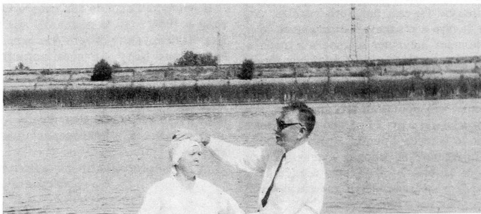
Крещение по вере в поселке Приволжский Саратовской области