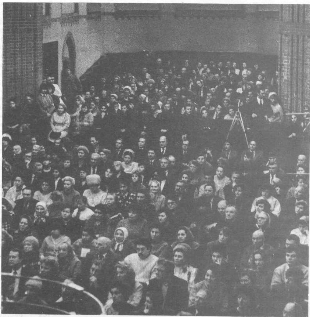
Празднование 1000-летия Крещения Руси в Калининграде.