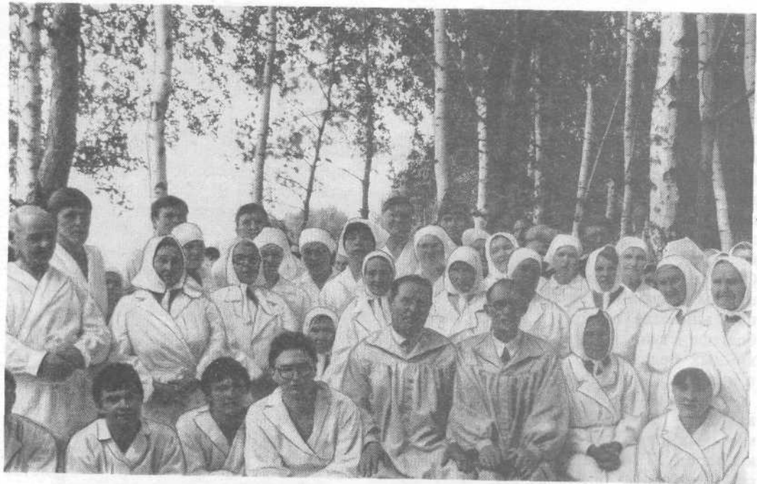
Крещаемые церкви города Воронежа со служителями церкви.