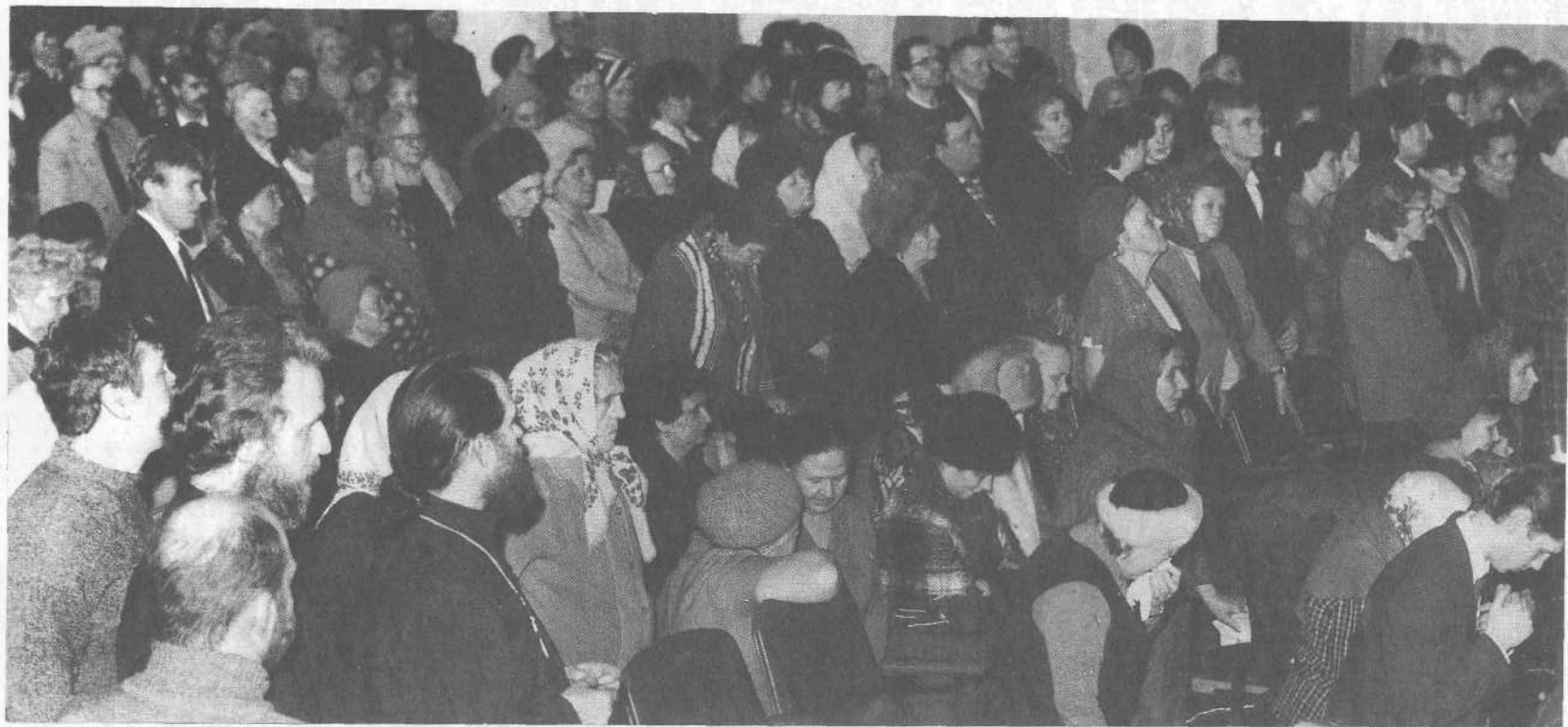
Празднование 1000-летия Крещения Руси в городе Иванове.