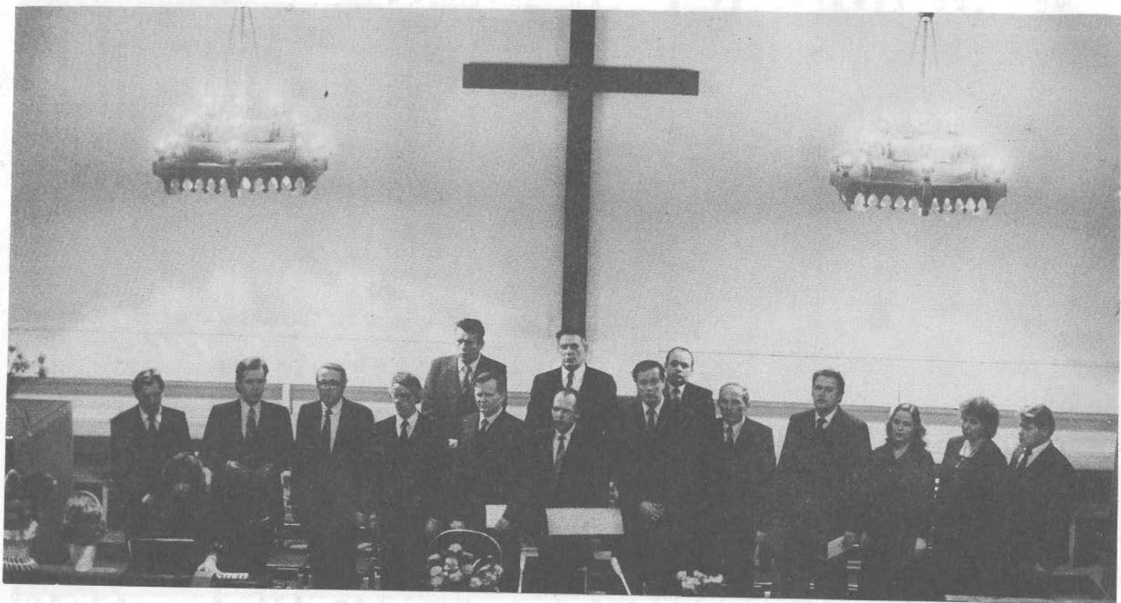
Хоровое пение в церкви Нымме города Таллина.