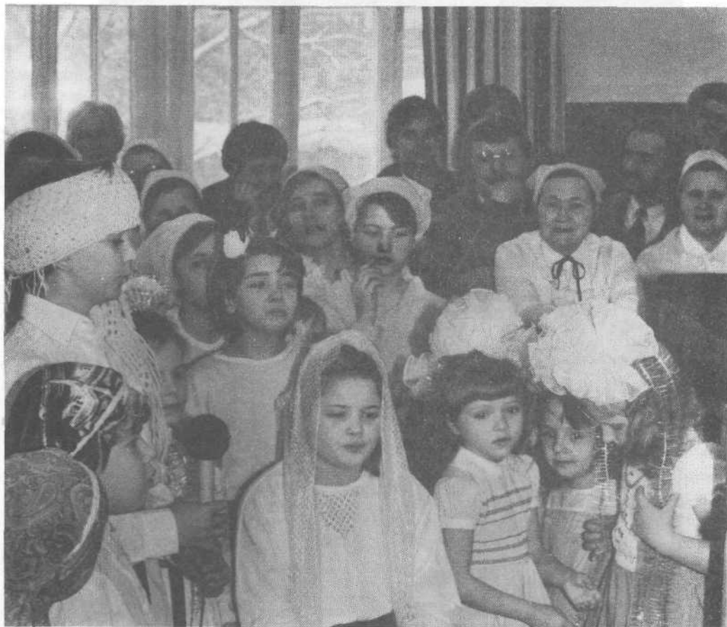
Детское рождественское общение в Московской церкви.