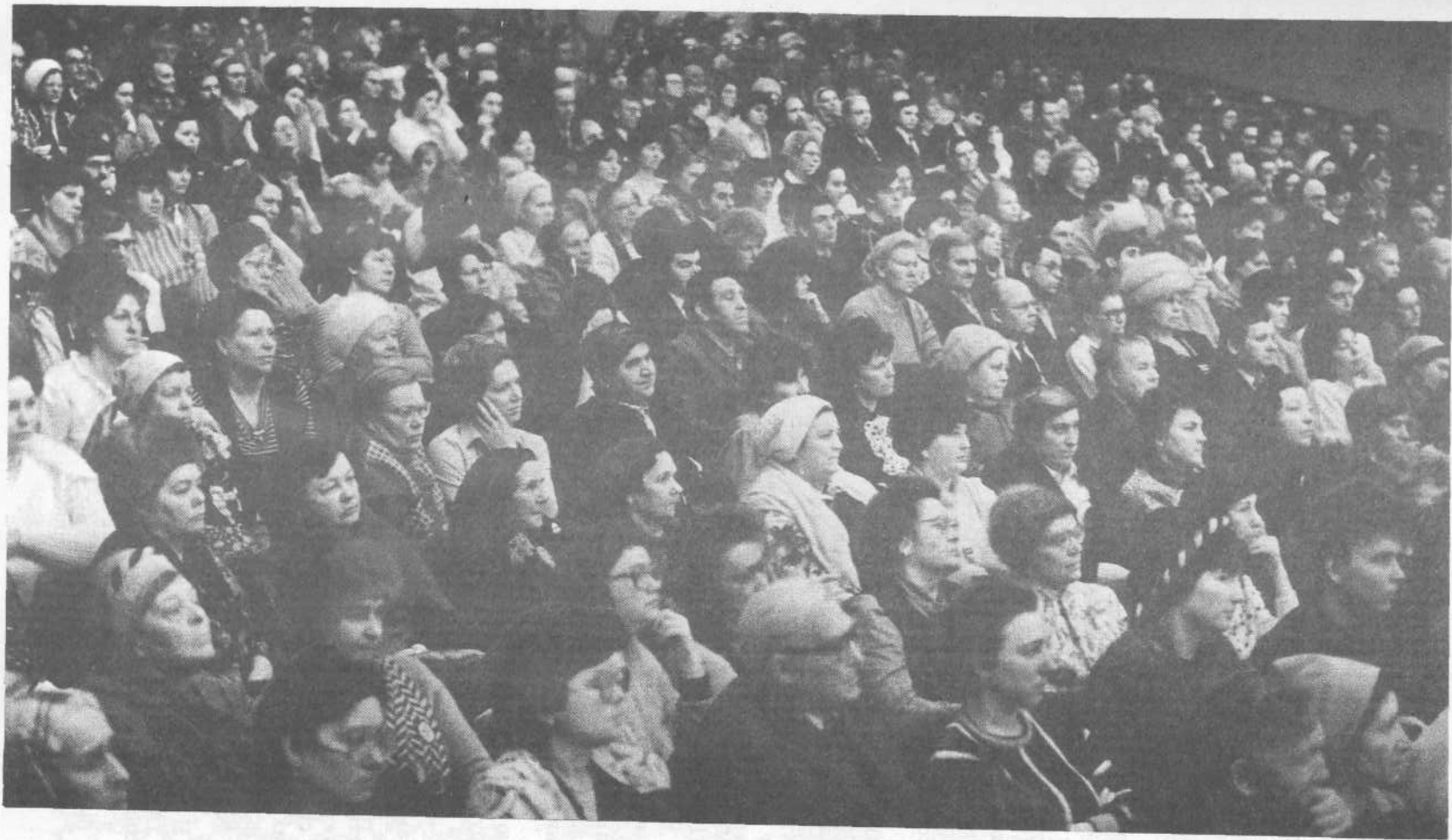
Собрание в одном из дворцов культуры города Москвы, посвященное 1000-летию Крещения Руси.