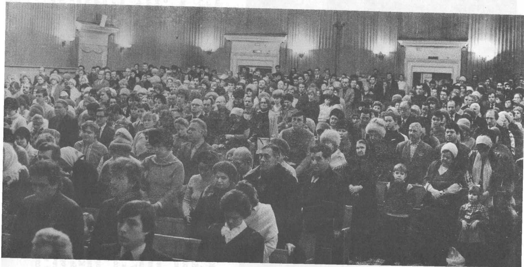
Богослужение, посвященное празднованию 1000-летия Крещения Руси в Мытищах Московской области.