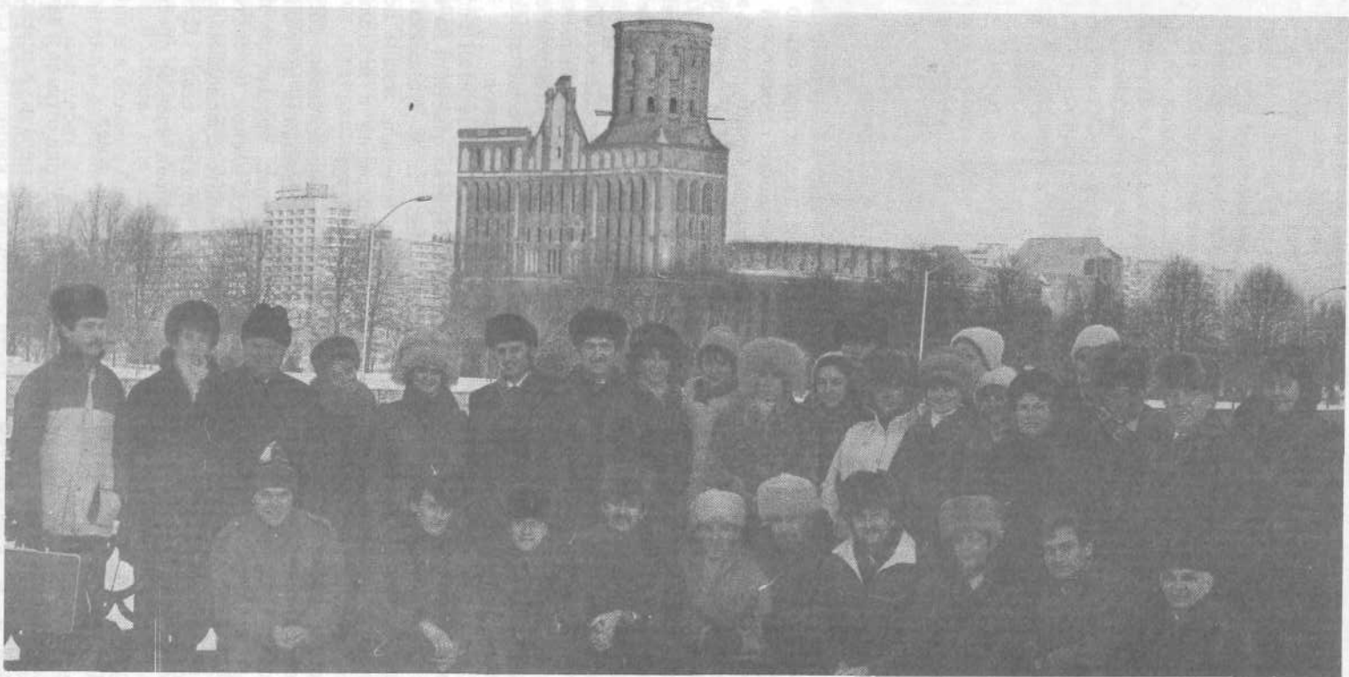
Верующие Московской церкви, принимавшие участие в праздновании 1000-летия Крещения Руси в Калининграде.