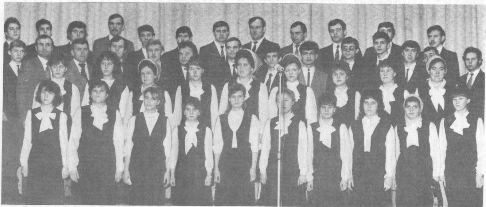
Хор церкви города Брянска.