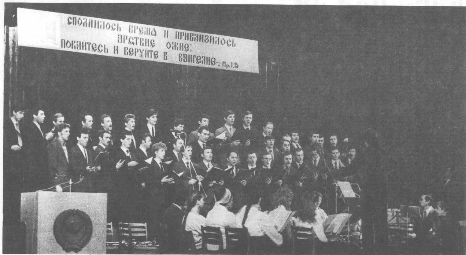
Выступление мужского хора и оркестра Московской церкви на юбилейном богослужении в Мытищах.