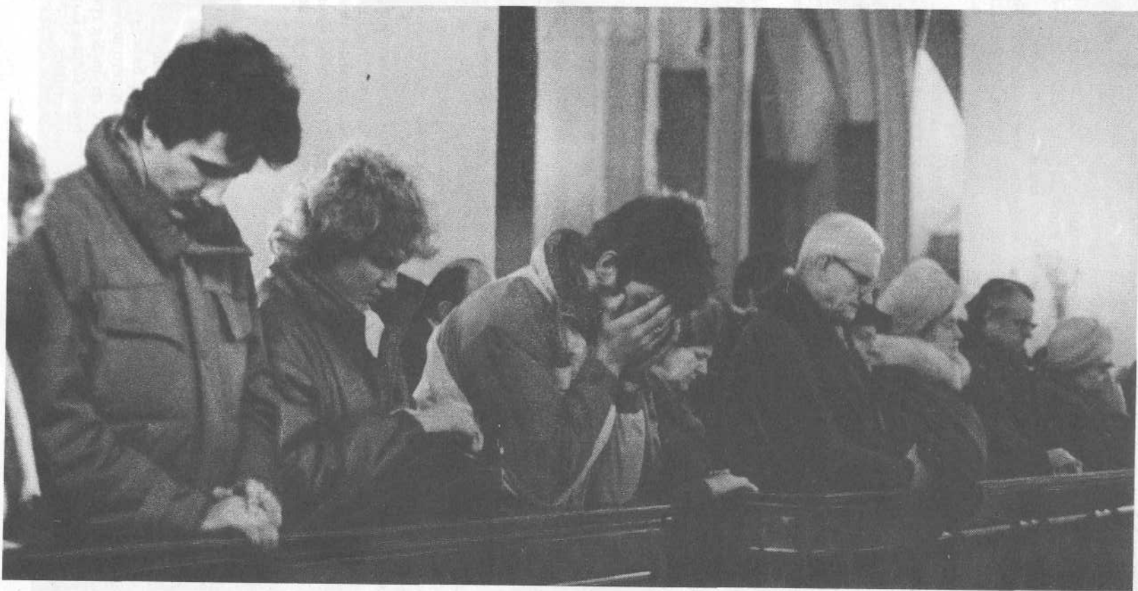
Богослужение в церкви Олевисте города Таллинна.