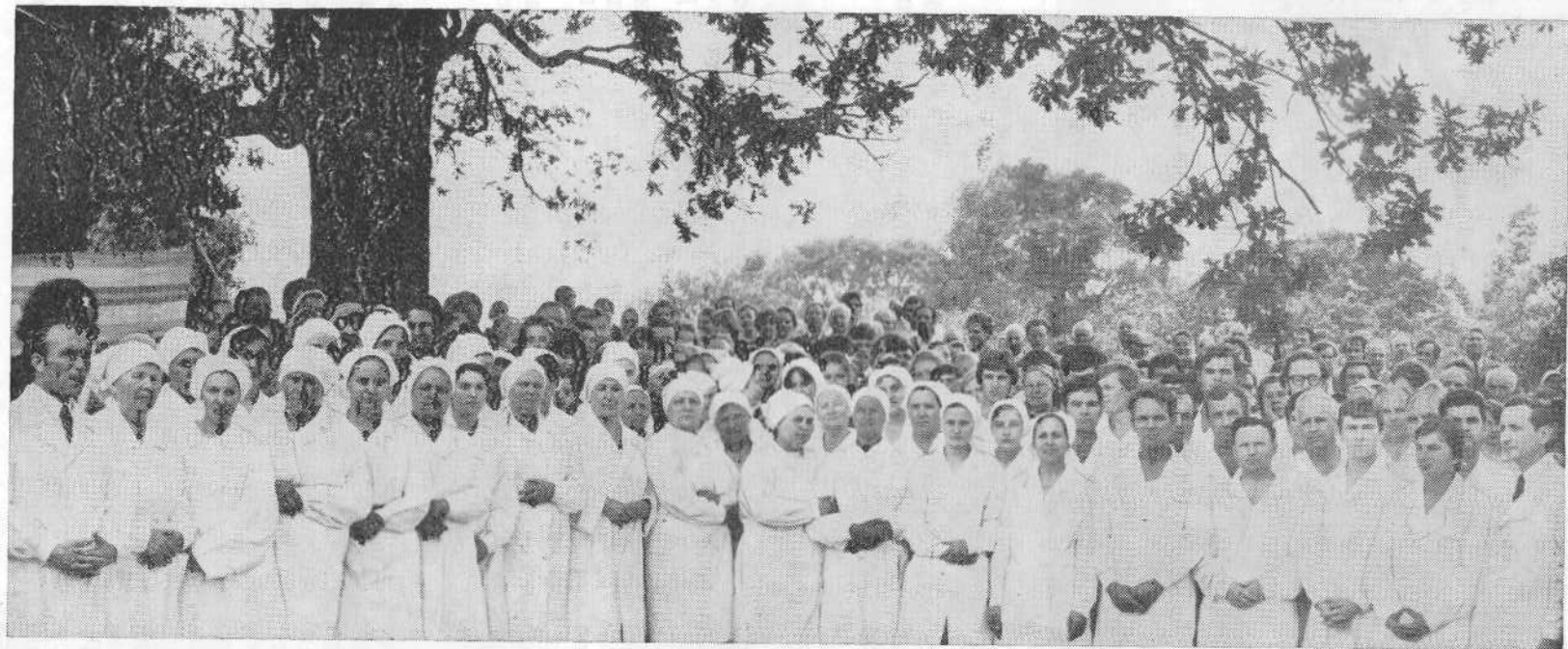
Крещаемые Киевской церкви.