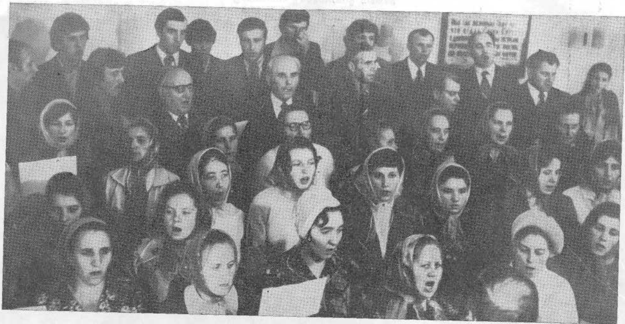
Хор церкви г. Барановичи.