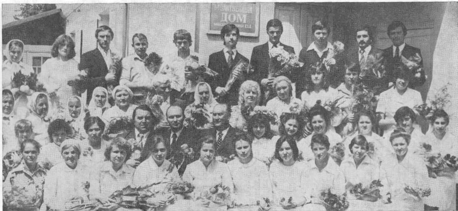
Новые члены Минской церкви вместе с руководящими братьями.