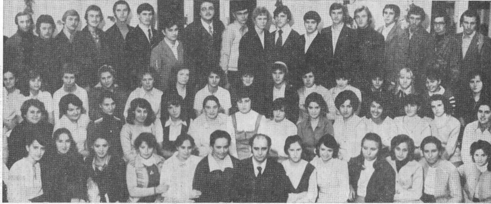
Третий хор Киевской церкви на Ямской.