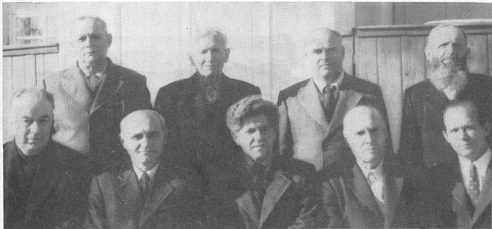
Руководящие братья Второй Алма-Атинской церкви.