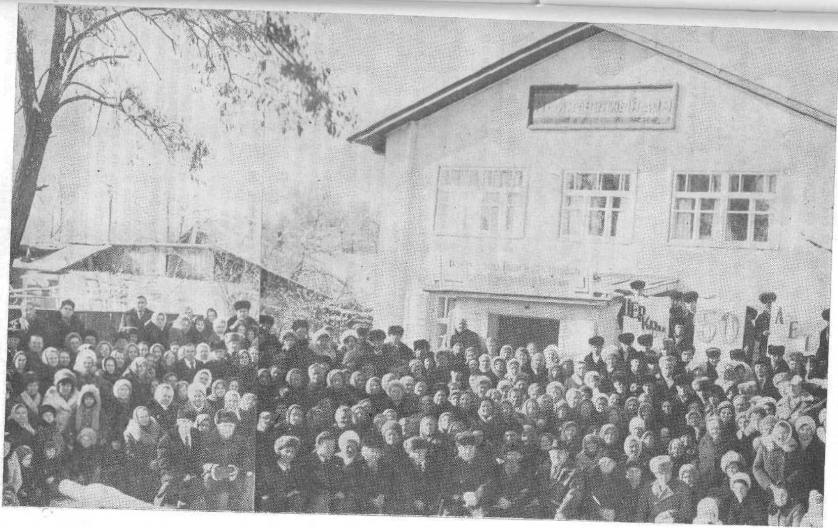
Верующие Второй Алма-Атинской церкви.