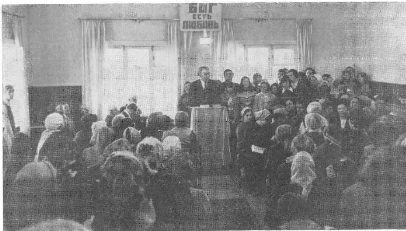
Богослужение в церкви г. Костромы.