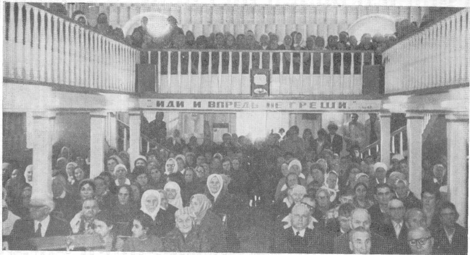
Богослужение в церкви г. Орджоникидзе.