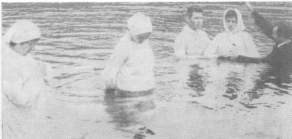
Крещение верующих Орловской церкви.