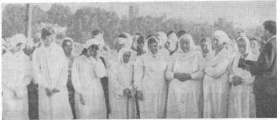
Перед крещением новых членов Хабаровской церкви.