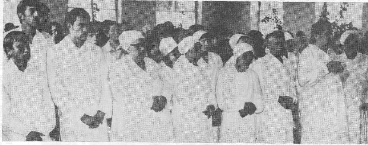
Перед крещением новых членов Кировоградской церкви.