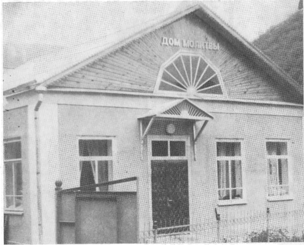
Новый молитвенный дом церкви г. Туапсе.