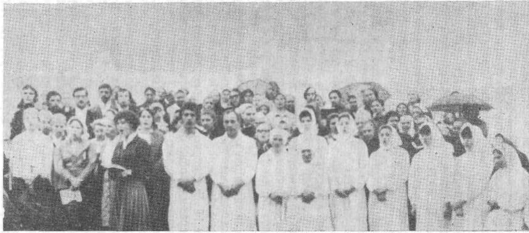
Перед крещением новых членов Орловской церкви.