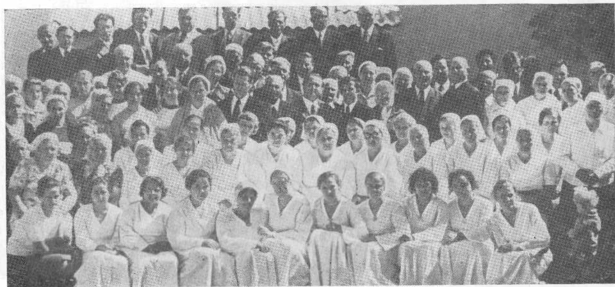
Хористы церкви г. Кустанай