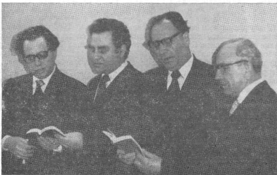
Гости из Болгарии