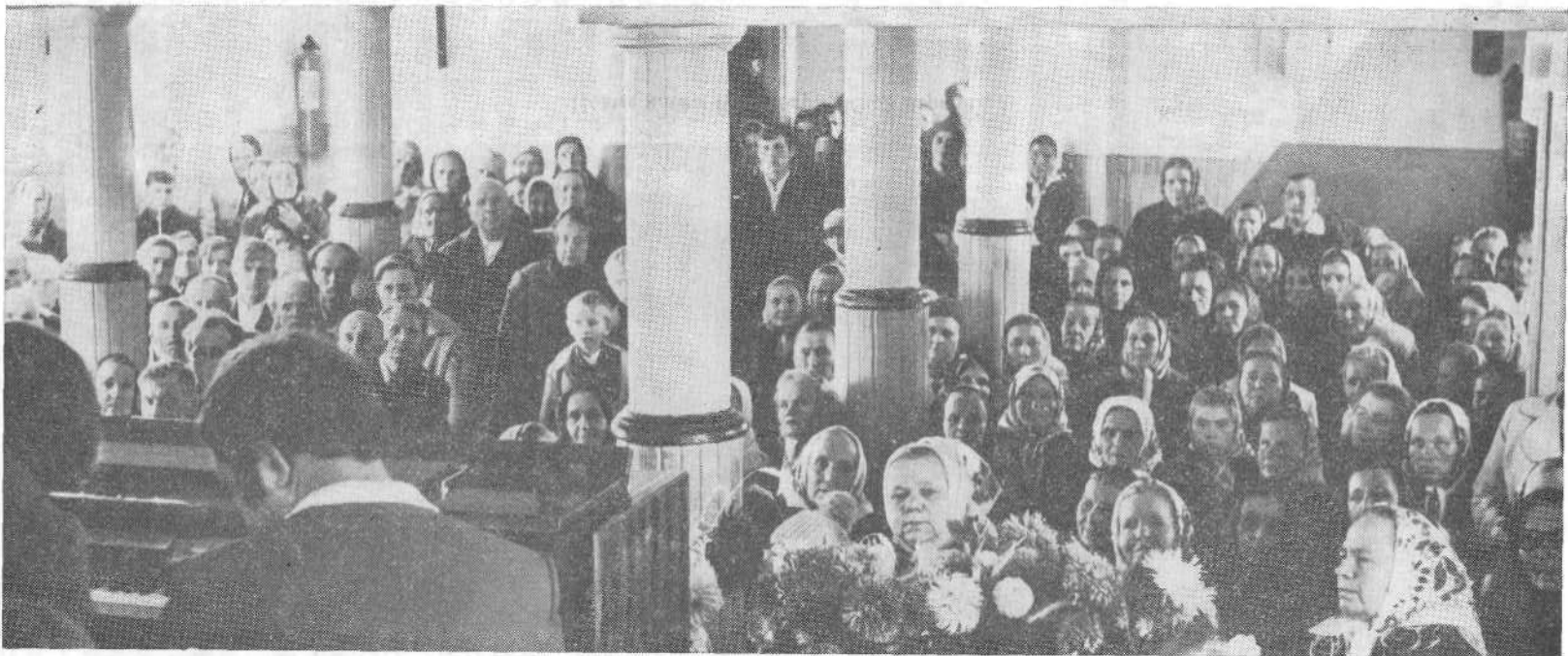
Богослужение в церкви г. Барановичи