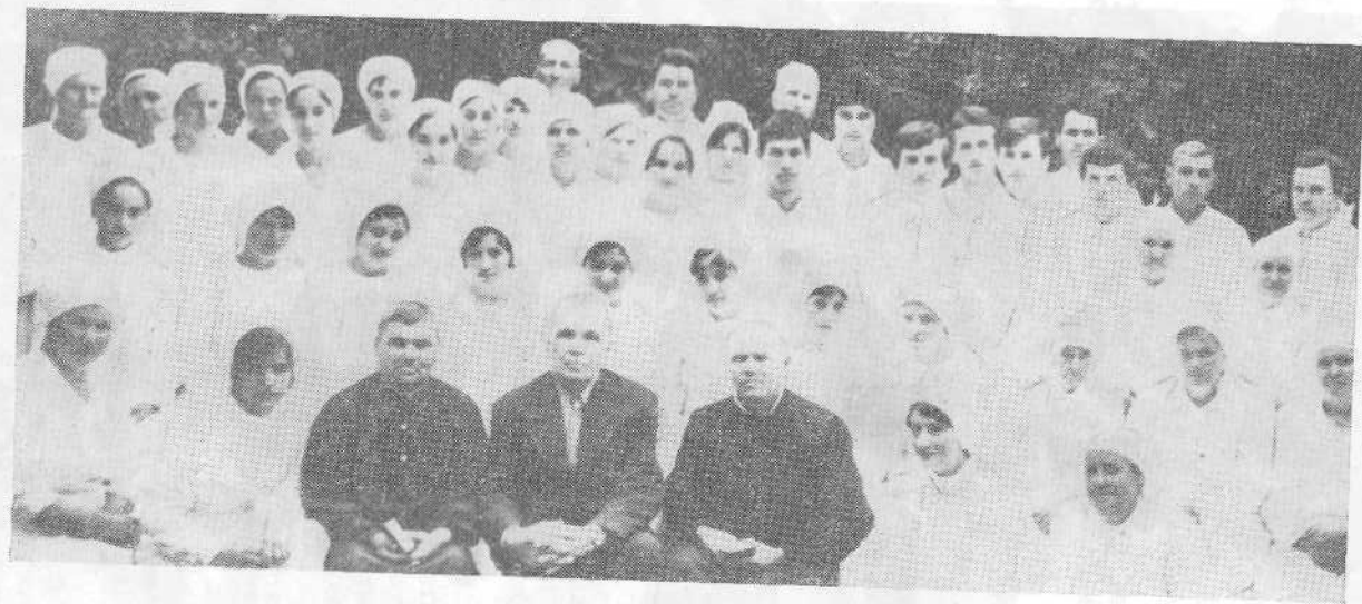
Новые члены Красноармейской церкви