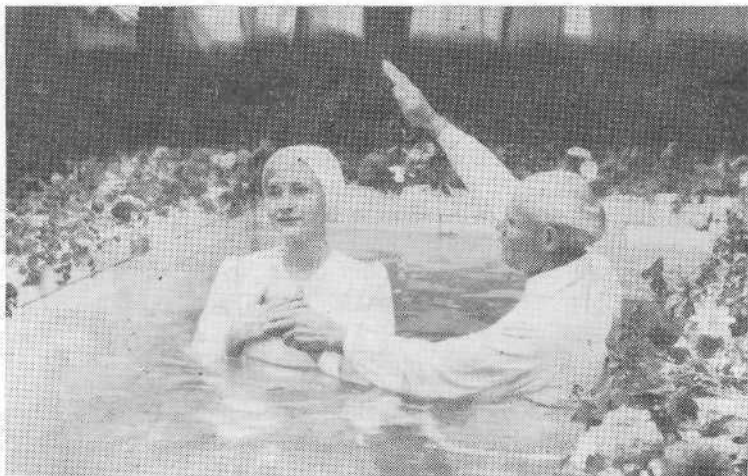
Крещение в г. Исыке