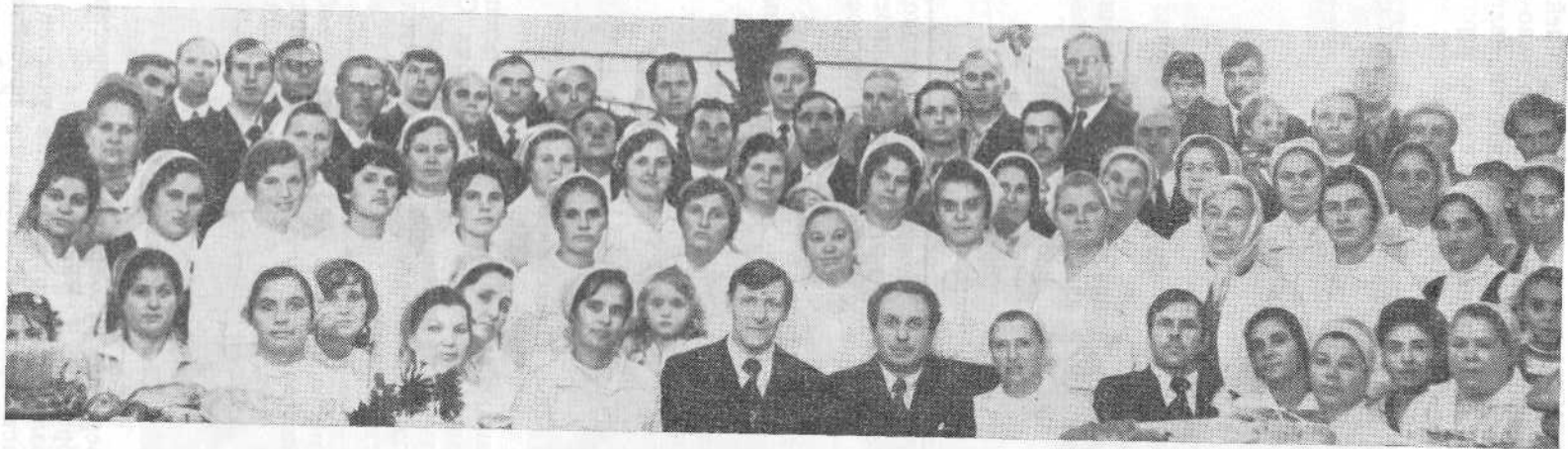
Хор и служители Кишиневской церкви