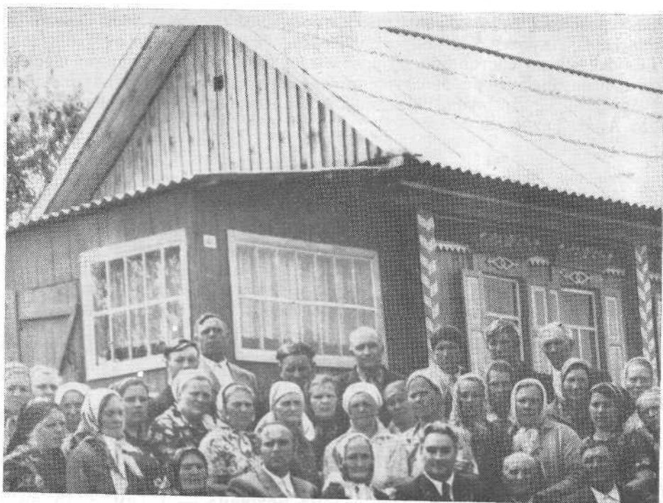
Верующие церкви в с. Александровке Красноярского края.