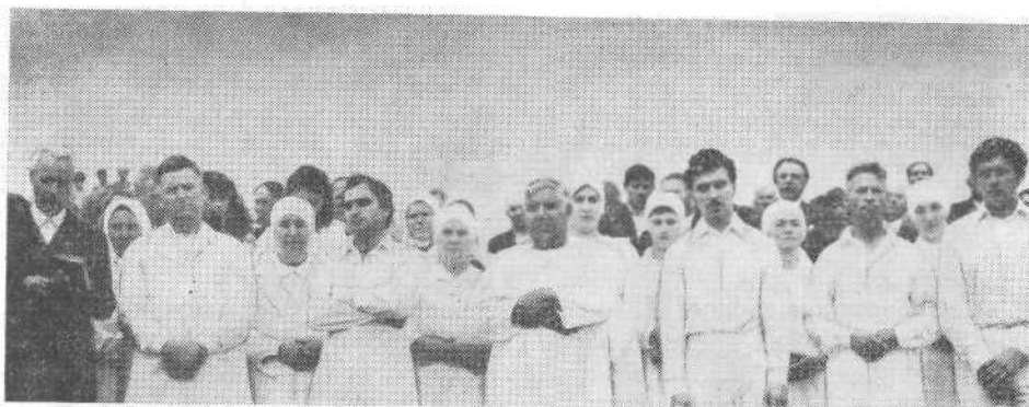
Крещаемые церкви в г. Хотин Черновицкой области.

После наставления и молитвы было совершено хлебопреломление, в котором приняли участие и новые члены церкви.