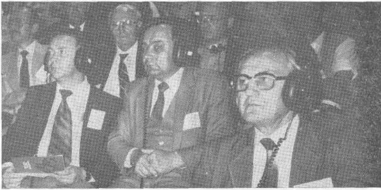
Представители ВСЕХБ на Международной конференции евангелистов, Амстердам, июль, 1983.