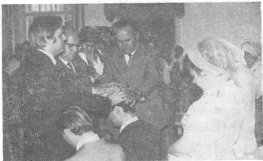
Рукоположение служителей Сыктывкарской церкви.

Первые проповедники Евангелия в этой местности засвидетельствовали об Иисусе Христе местным жителям. Эта весть глубоко проникла в их сердца, и они стали жить по Евангелию и исповедовать Иисуса Христа. С тех пор и до настоящего времени служители Христовы возвещают о Его чудных делах, призывая грешников на путь спасения.