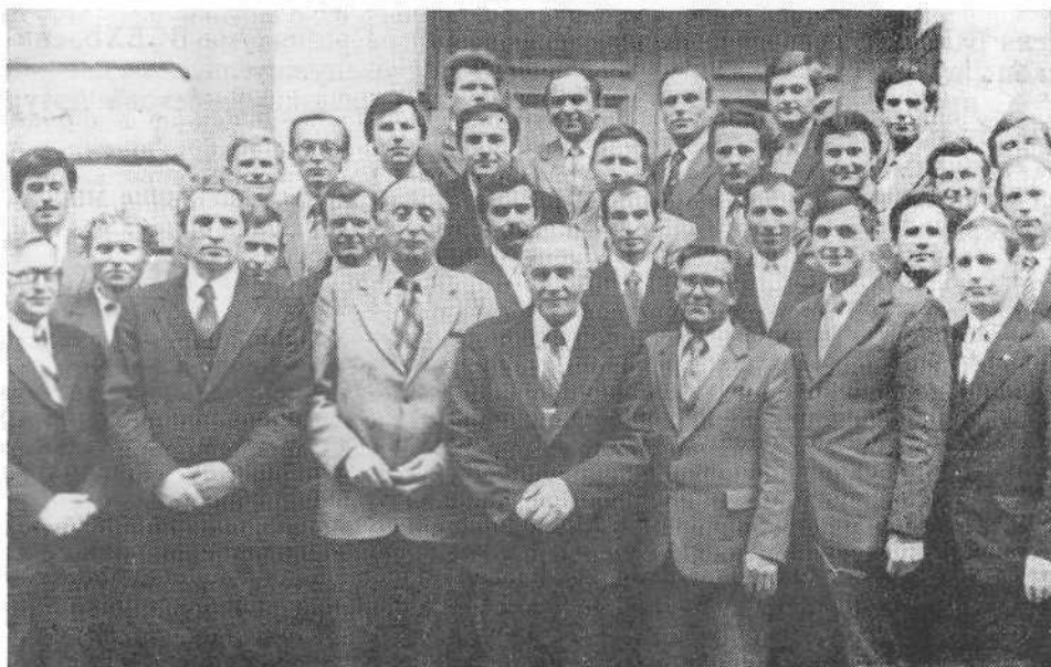
Руководители ВСЕХБ и преподаватели ЗБК с курсантами нового набора.