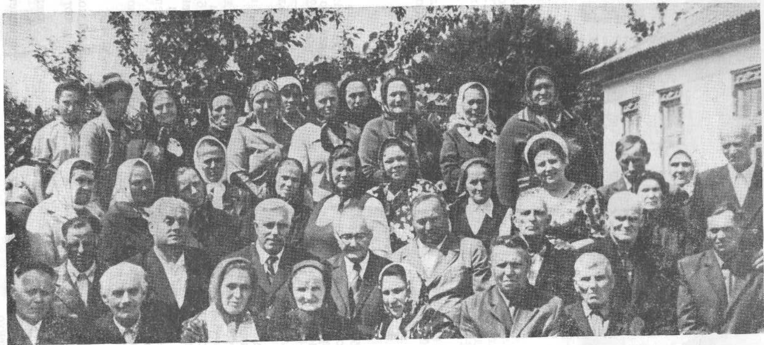
Верующие церкви п. Ракитное Киевской области.