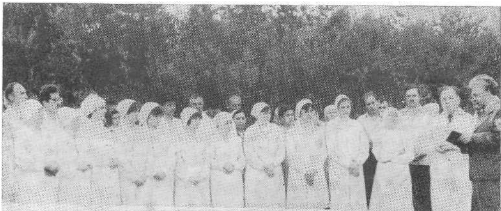
Крещаемые Черкасской церкви.

Из-под его пера вышло свыше 420 музыкальных произведений — гимнов, молитвенных псалмов, ораторий. Наверное, нет такого хора в нашем братстве, который не исполнял бы его произведений. При этом брат никогда не приписывал успеха себе, а всегда говорил словами псалмопевца: «Не нам, Господи, не нам, но имени Твоему дай славу» — Пс. 113, 9.