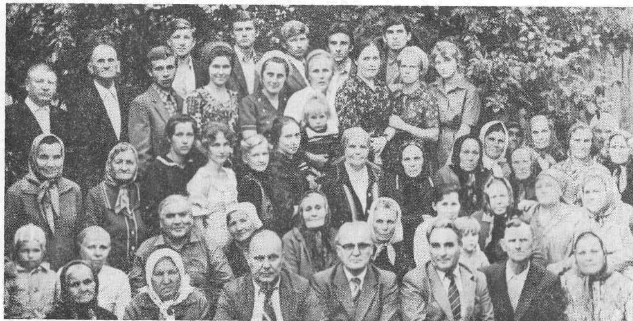
Представители ВСЕХБ среди верующих Минусинской церкви Красноярского края.