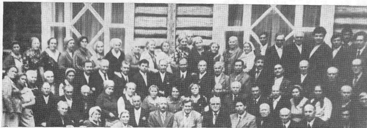
Представители ВСЕХБ среди участников семинара служителей церквей Д. Востока.