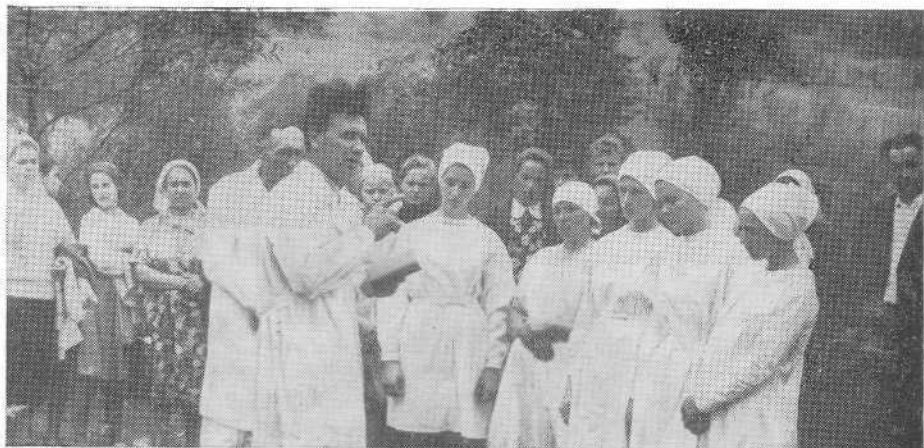
Перед крещением верующих Хмельницкой церкви.