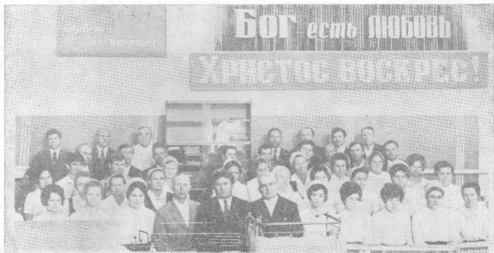
Хор церкви гор. Ферганы.