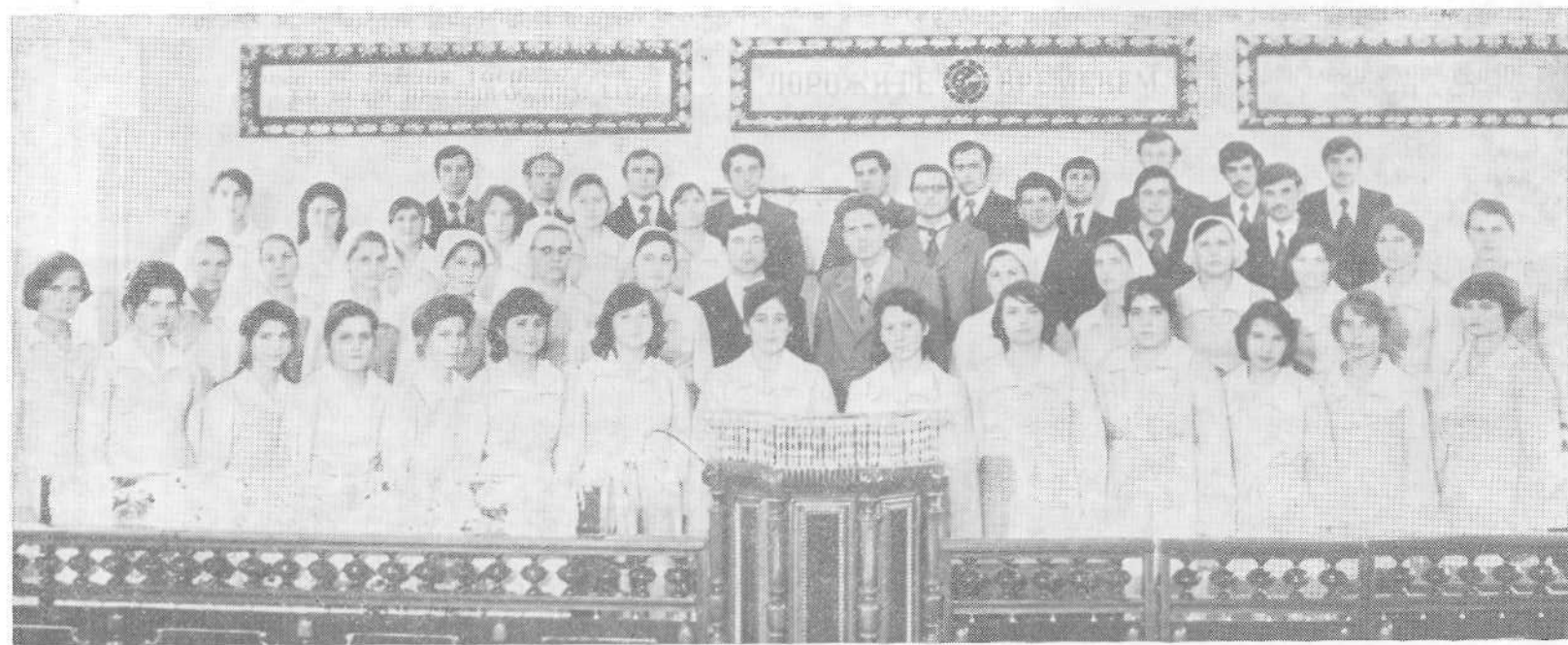
Хор церкви гор. Измаила.