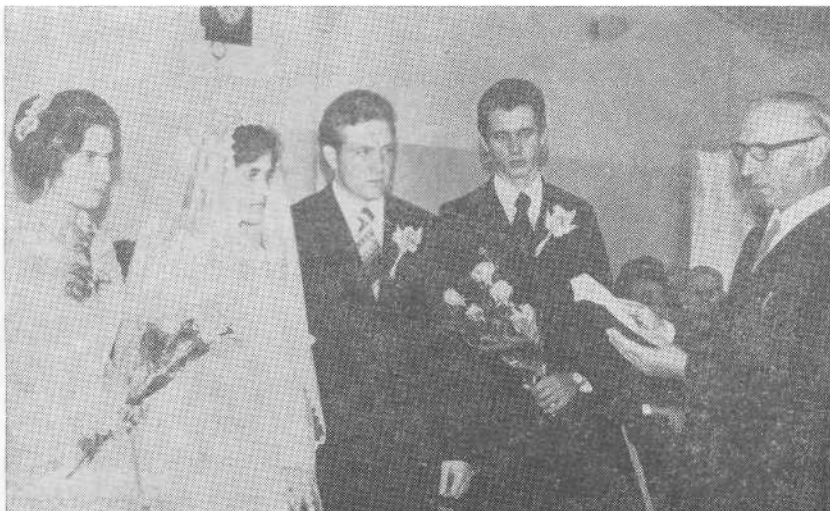
Бракосочетание в церкви г. Ферганы.

ВСЕХБ, ответили на многочисленные вопросы, касающиеся евангельско-баптистского братства в целом.