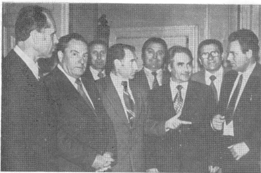
В перерыве между заседаниями июньского 1981 г. Пленума ВСЕХБ.

В чем же они заключаются? В том, что он опирается на помощь и поддержку сослужителей: «Без совета предприятия расстроятся, а при множестве советников они состоятся» — Пр. 15, 22.