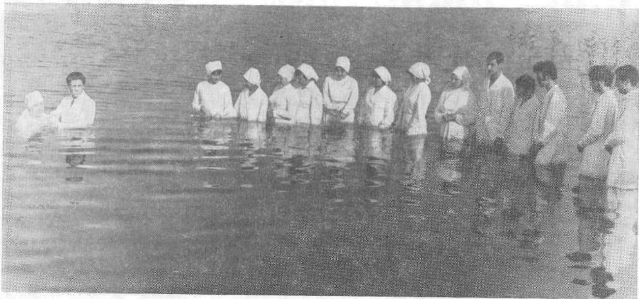
Крещение верующих церкви г. Измаила.