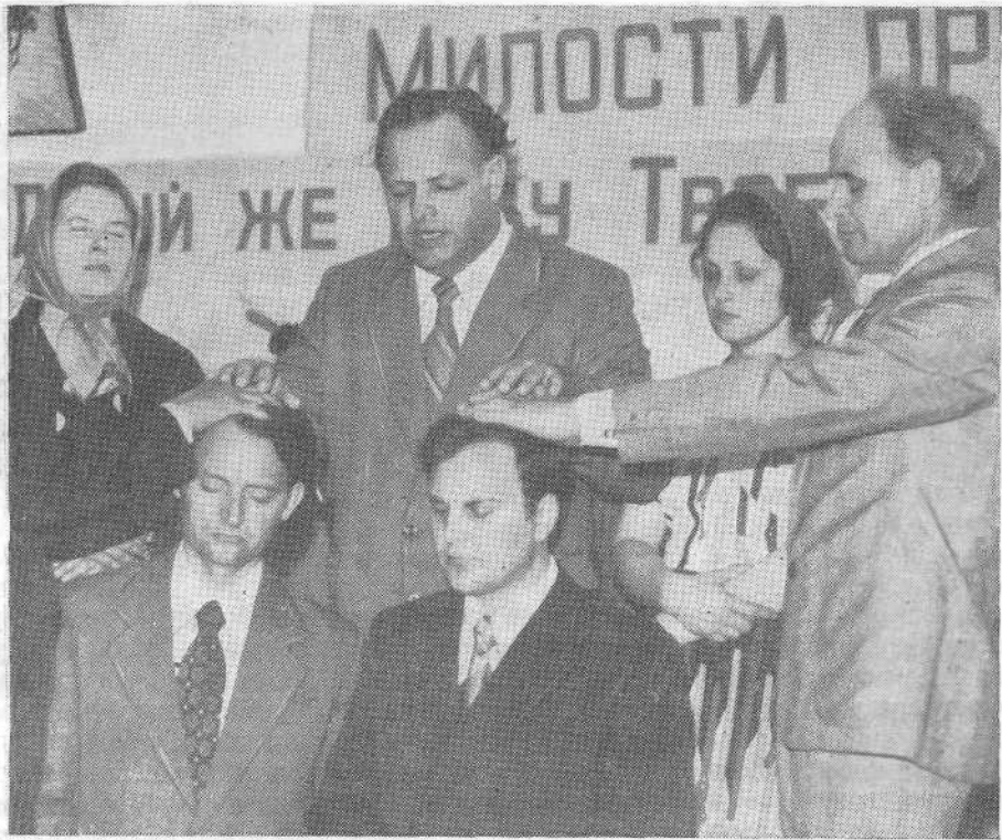
Рукоположение диаконов церкви г. Кривого Рога.

примерами, и в нем содержался призыв к более ревностному служению в деле проповеди Евангелия и спасения грешников, а также к духовно-воспитанию верующих для достижения единства во Христе.