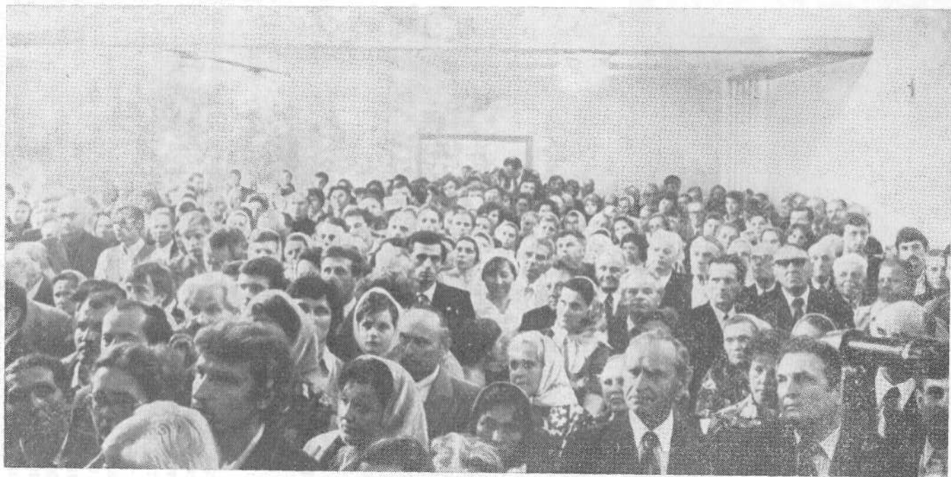
Богослужение в Львовской церкви.