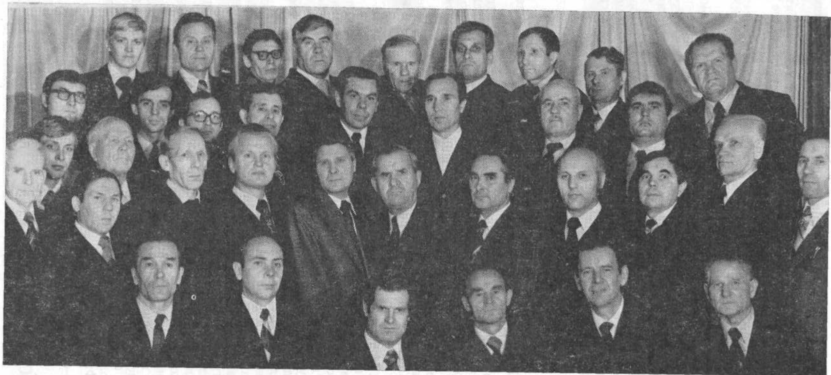
Руководство и проповедники Новосибирской церкви.