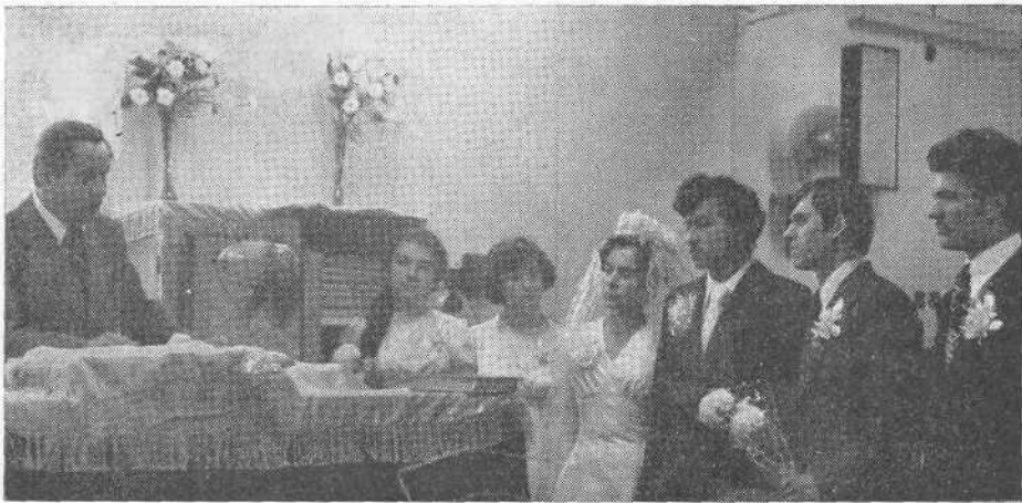
Бракосочетание в Павло-Кичкасской церкви г. Запорожье.