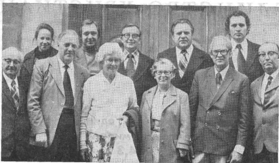
Зарубежные гости с сотрудниками ВСЕХБ.

шием и сердечно. Они разделяли радость общения с верующими и познакомились с достижениями всего нашего народа.