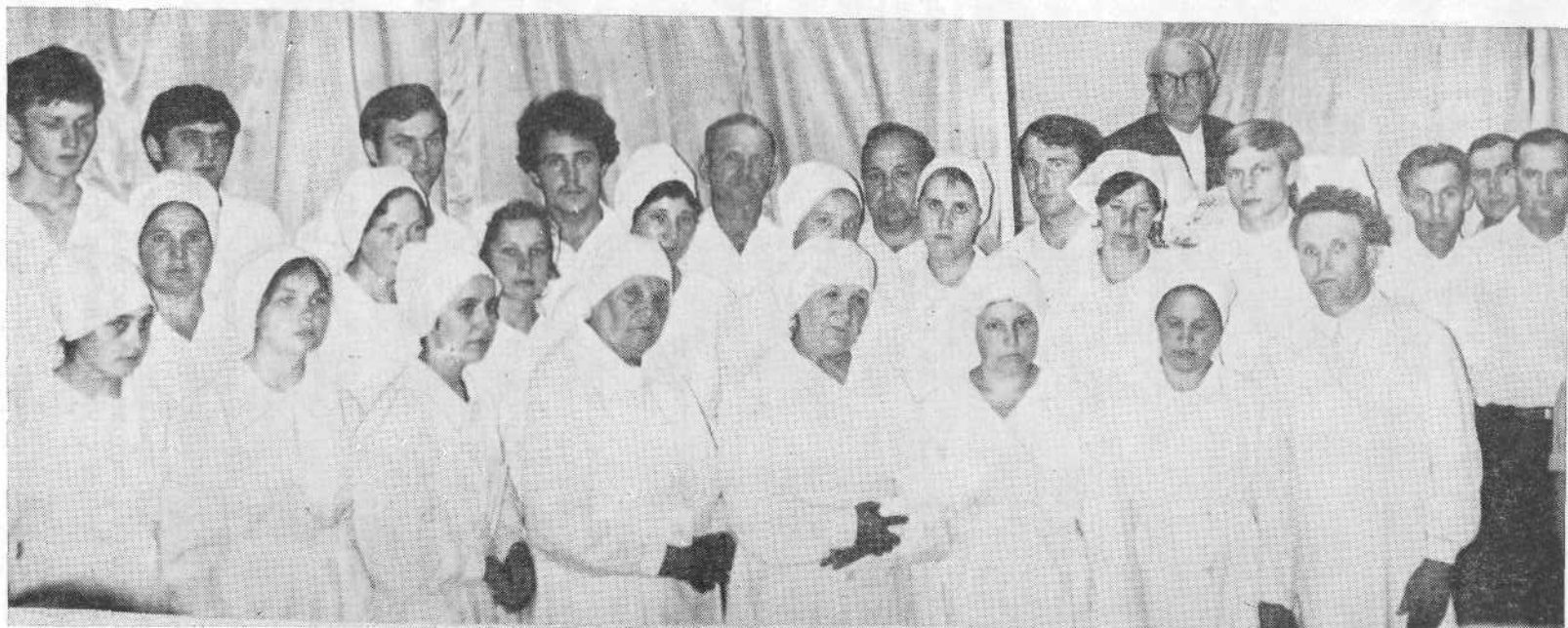
Новые члены Георгиевской церкви