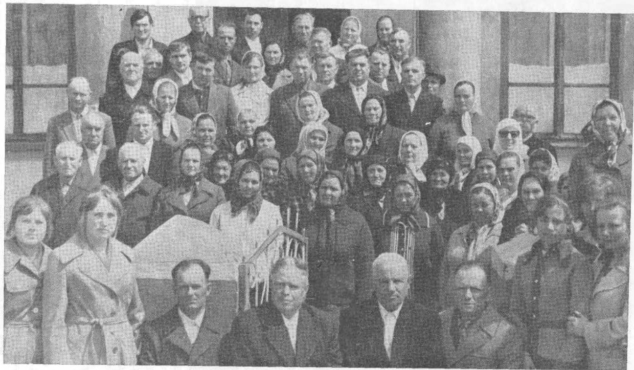
Церковь с. Проданешты, Молдавия.