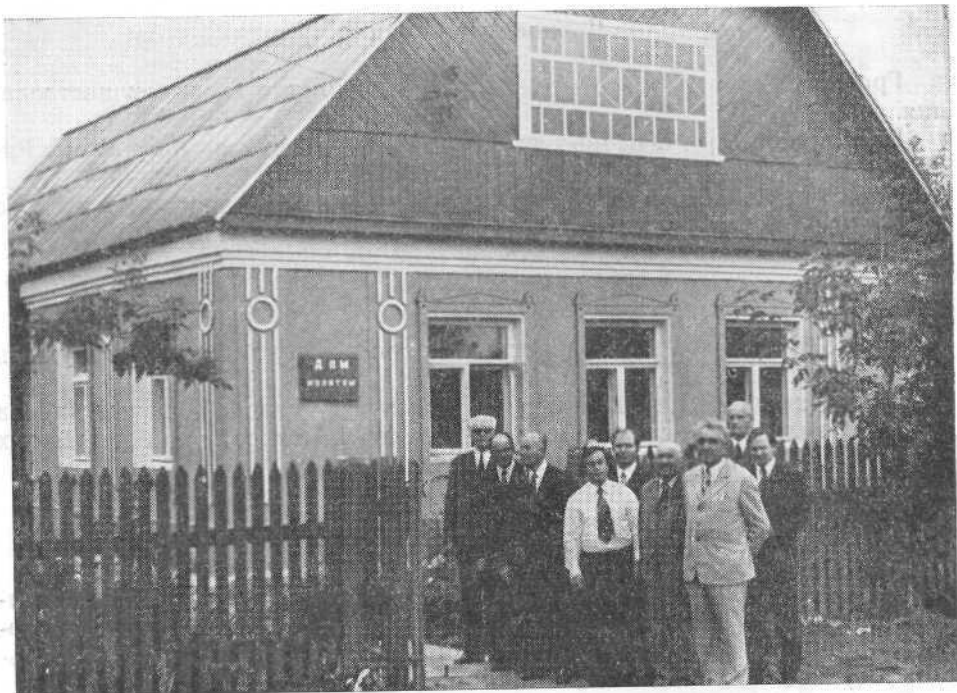
Новый молитвенный дом в Воскресенске (Московская область).