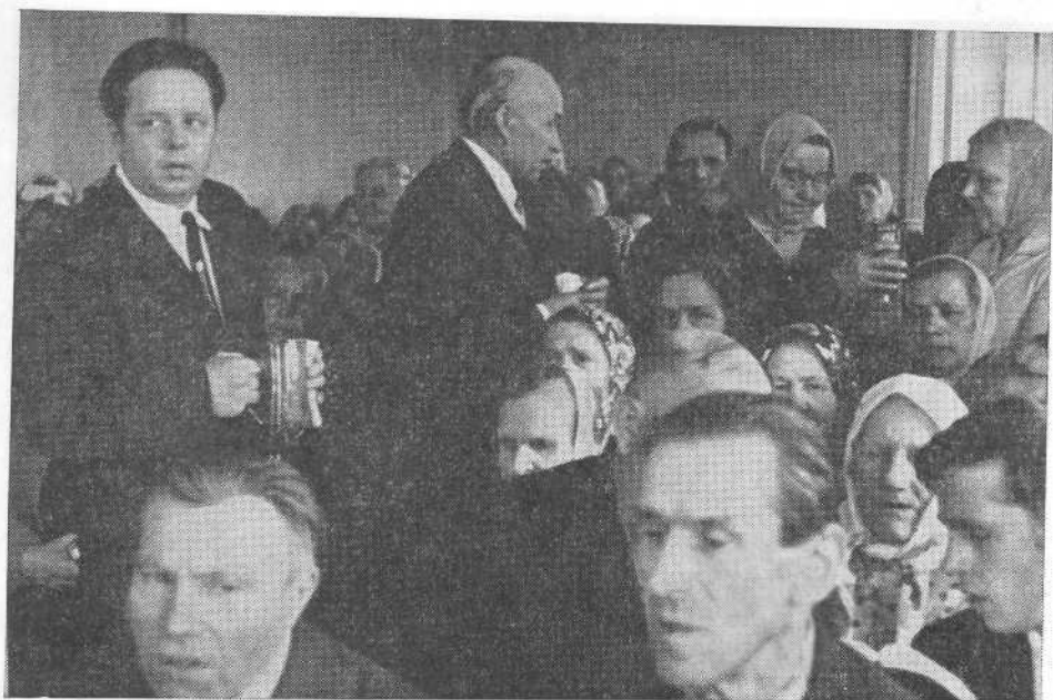
Богослужение в Смоленской церкви.