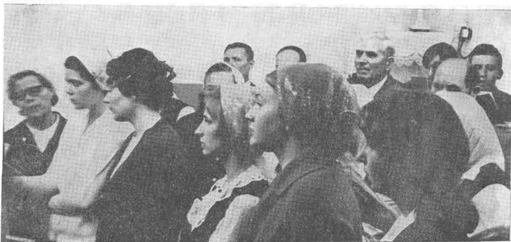
Богослужение в Ульяновской церкви.