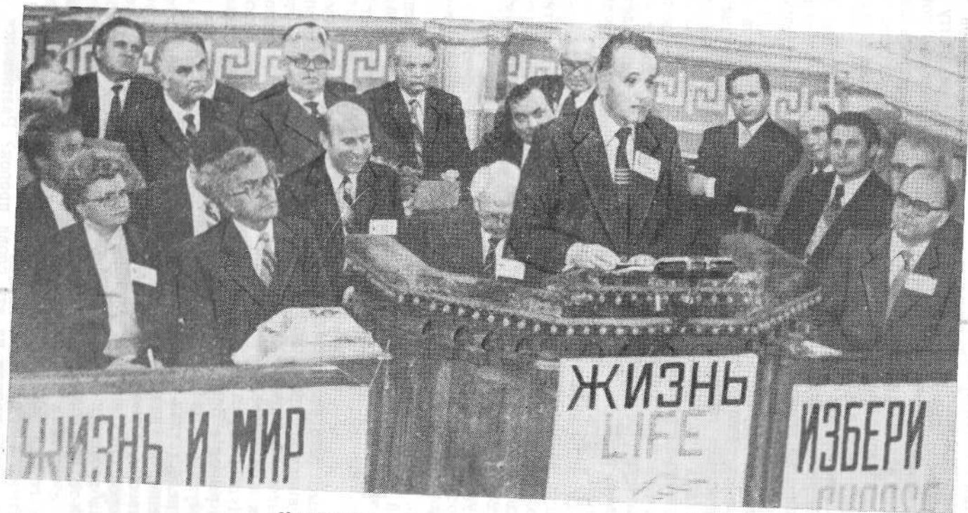
Участники международного семинара «Жизнь и мир» на богослужении в МОЕХБ.