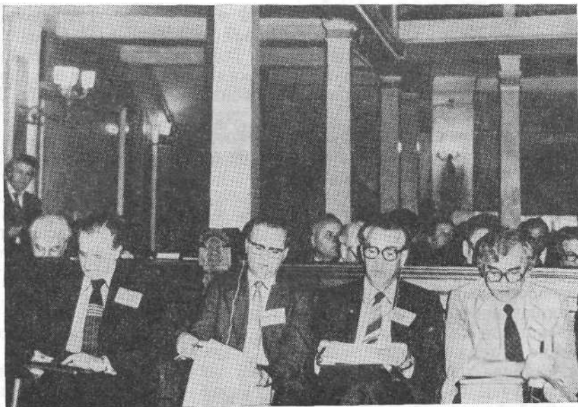
Заседание международного семинара «Жизнь и мир».

пленных Кровию Христа и призванных свидетельствовать о Нем в этом мире. Дух Святой обитает в Церкви. Он является автором и толкователем учения Иисуса Христа, изложенного в Евангелии.