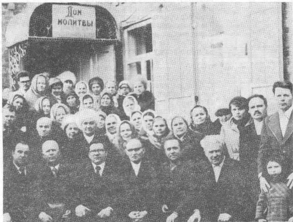
Группа верующих Тимашевской церкви Краснодарского края.