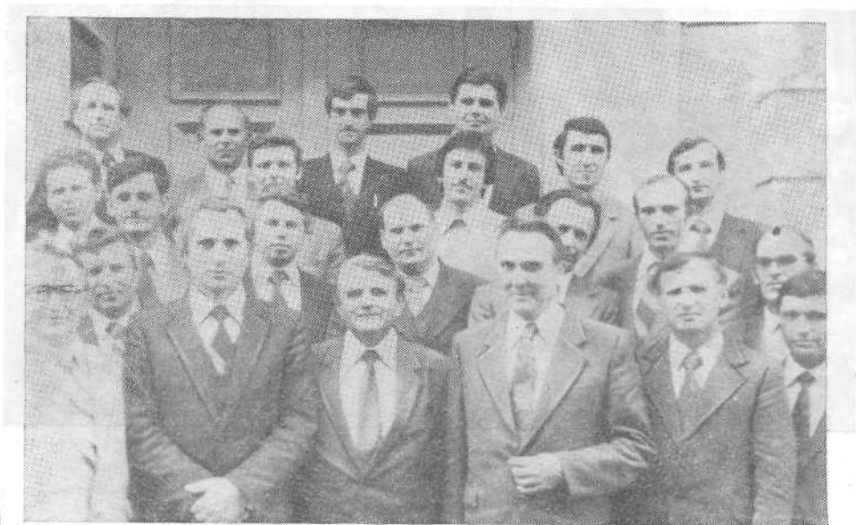
Группа курсантов с преподавателями заочных Библейских курсов.