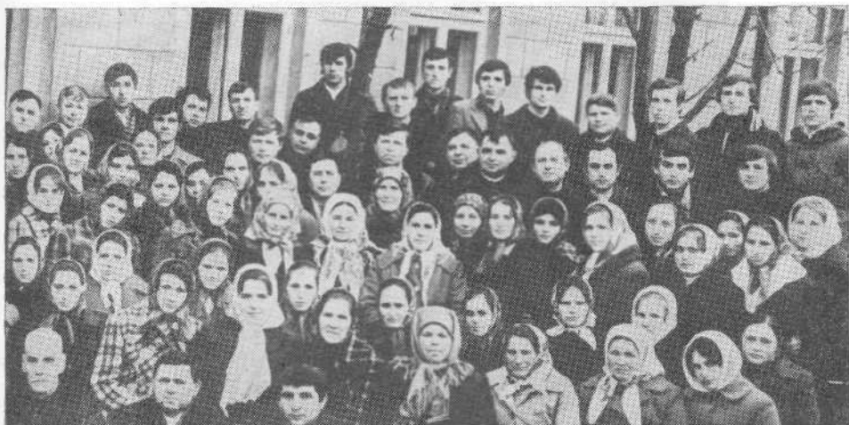
Верующие Кулебашской церкви.