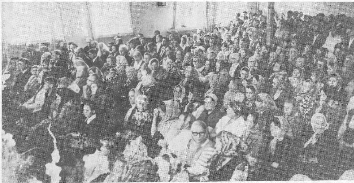
Богослужение в Вильнюсской церкви.