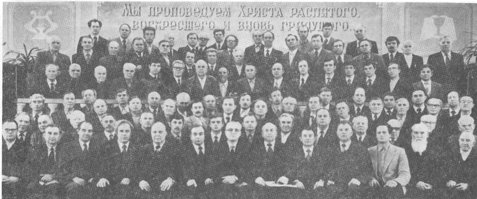
Участники совещания представителей церквей Ростовской области и Северного Кавказа.