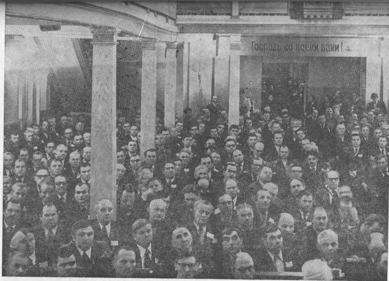
Заседание 42-го съезда ЕХБ. Москва, декабрь 1979 г.