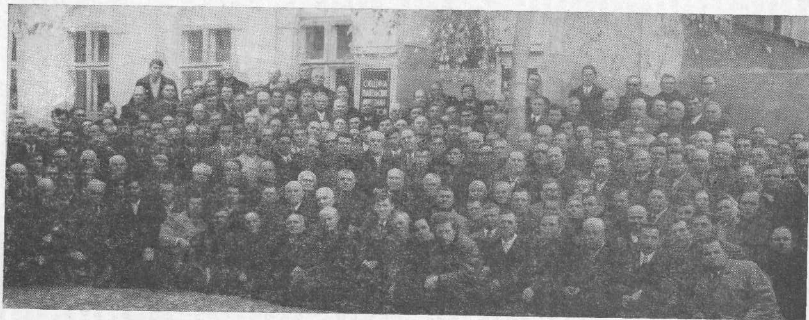
Участники предсъездовского совещания представителей церквей Молдавии.