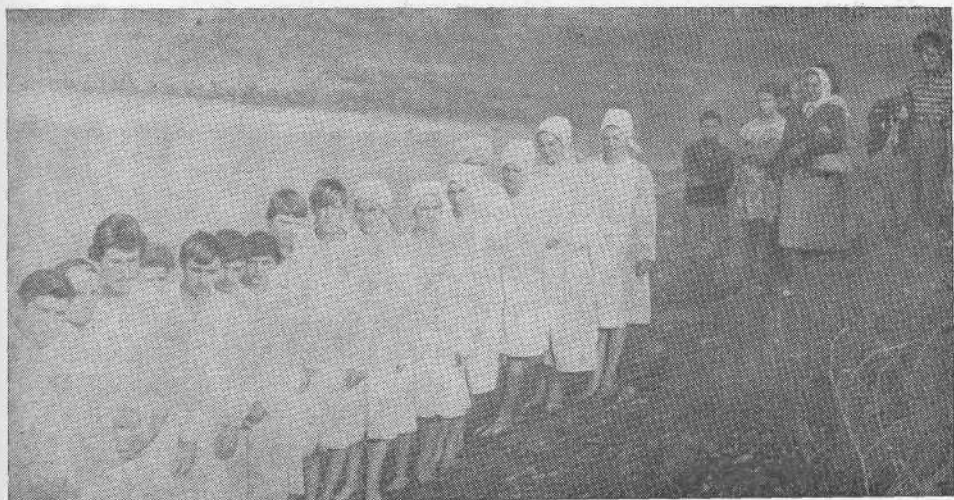
Крещаемые церкви г. Крымска Краснодарского края.

словят вас за имя Христово, то вы блаженны, ибо Дух славы, Дух Божий почивает на вас: теми он хулится, а вами прославляется» — 1 Пет. 4, 14. «Они дадут ответ Имеющему вскоре судить живых и мертвых» — 1 Пет. 4, 5.