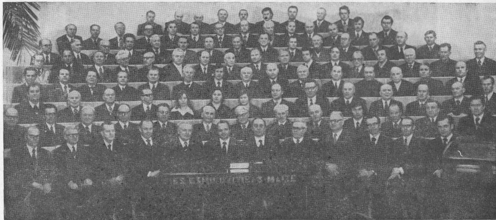
Участники предсъездовского совещания представителей церквей Латвии.