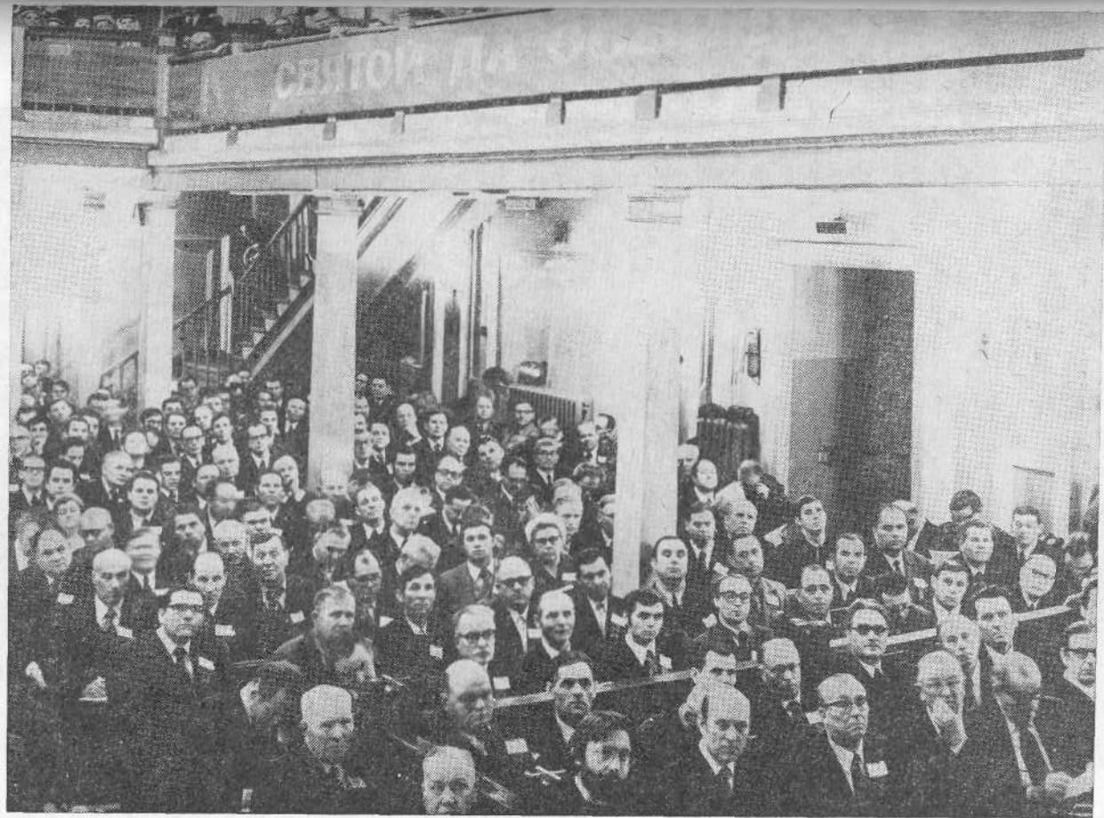
Заседание 42-го съезда ЕХБ. Москва, декабрь 1979 г.