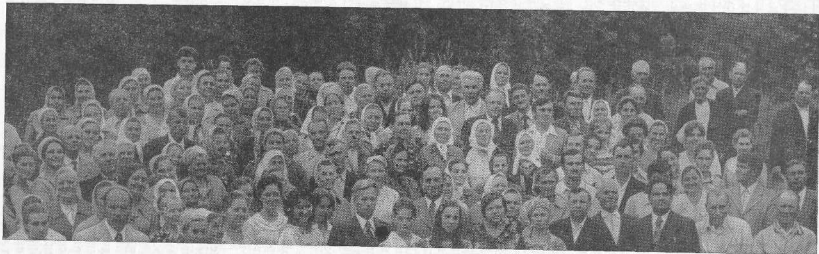
Перед крещением новых членов церкви г. Сумы.