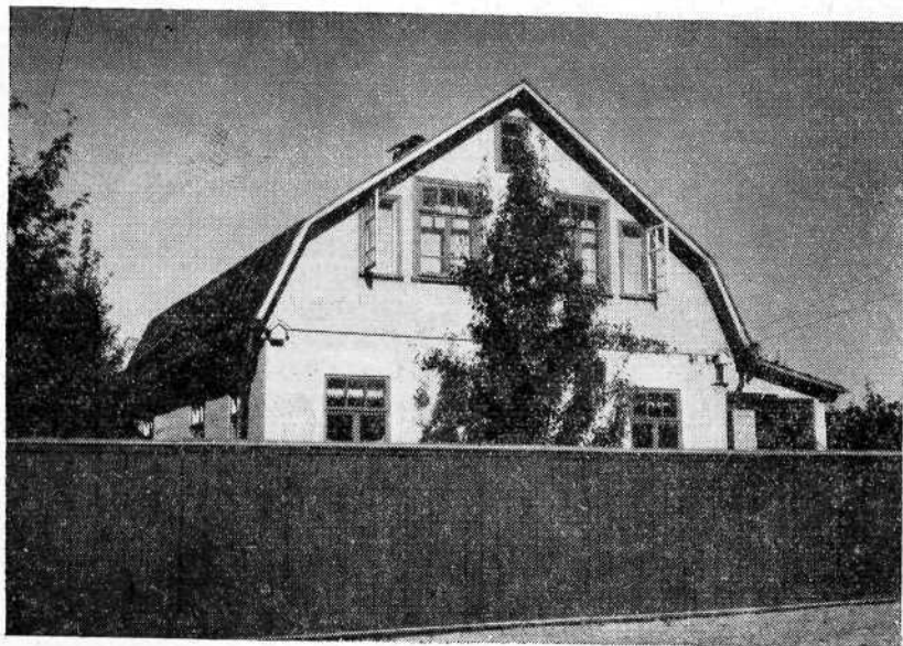
Молитвенный дом Святошинской общины евангельских христиан-баптистов в г. Киеве.