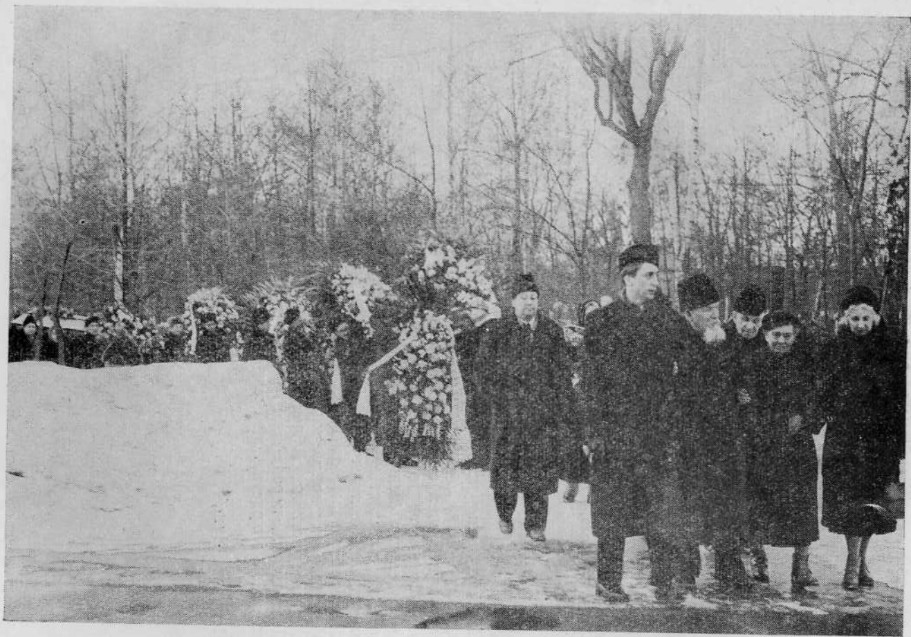
Траурное шествие на кладбище