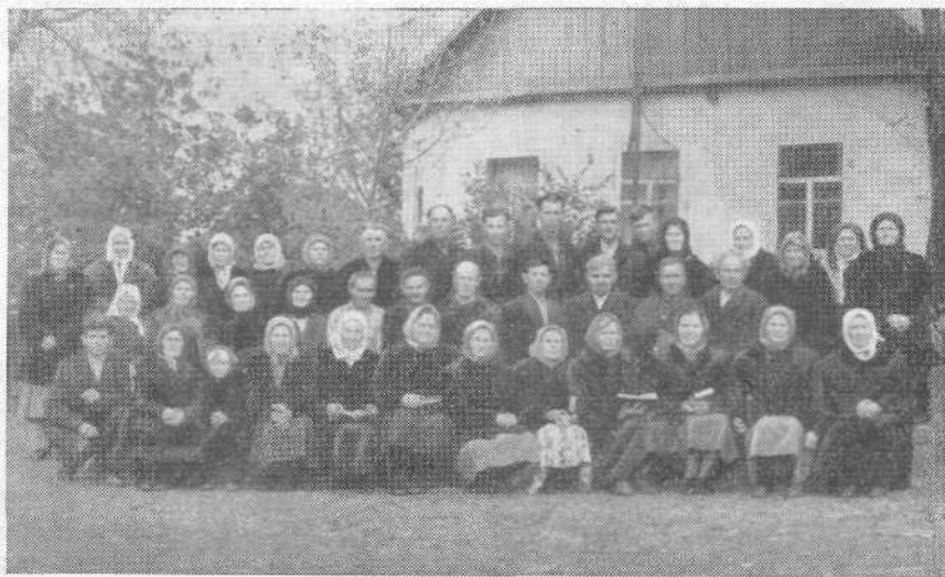
Масловская церковь евангельских христиан-баптистов, Харьковской обл.