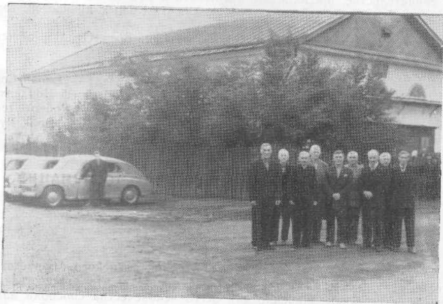
Молитвенный дом Карагандинской церкви евангельских христиан-баптистов