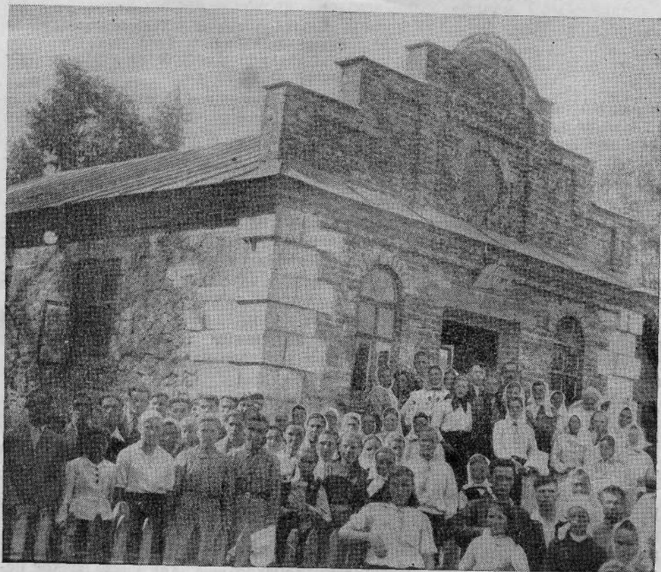
Молитвенный дом общины христиан-баптистов (Башуки, Тернопольской обл.)