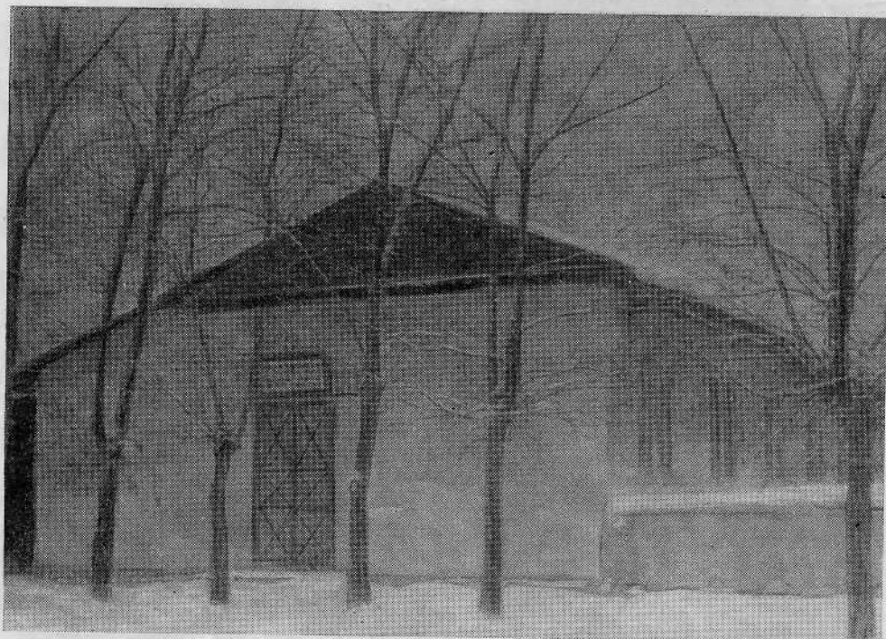
Молитвенный дом Алма-Атинской общины евангельских христиан-баптистов