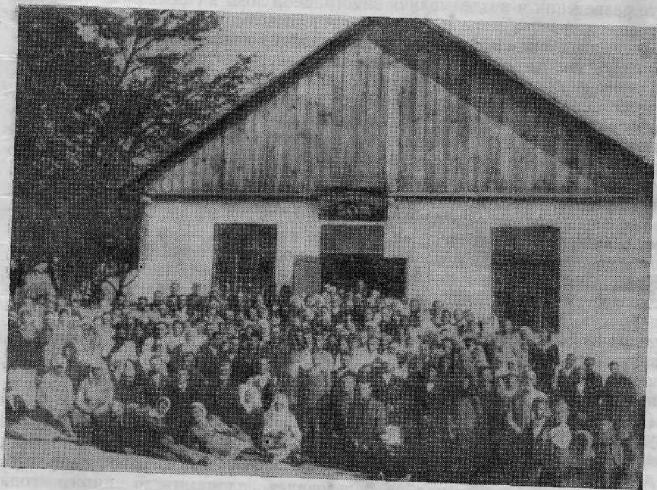
Молитвенный дом Шепетовской общины евангельских христиан-баптистов (УССР)