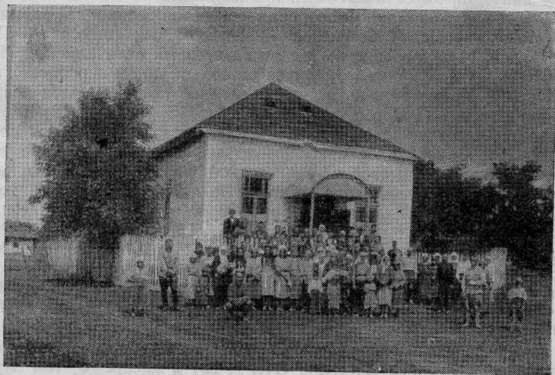
Молитвенный дом общины евангельских христиан-баптистов (с. Радон, Молдавской ССР)