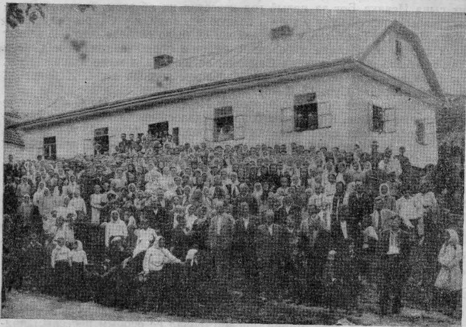
Молитвенный дом Горинковской общины евангельских христиан-баптистов (УССР)