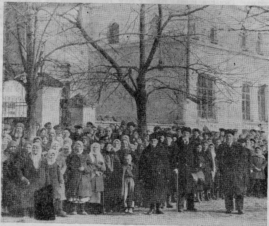
Молитвенный дом Краснодарской общины евангельских христиан-баптистов