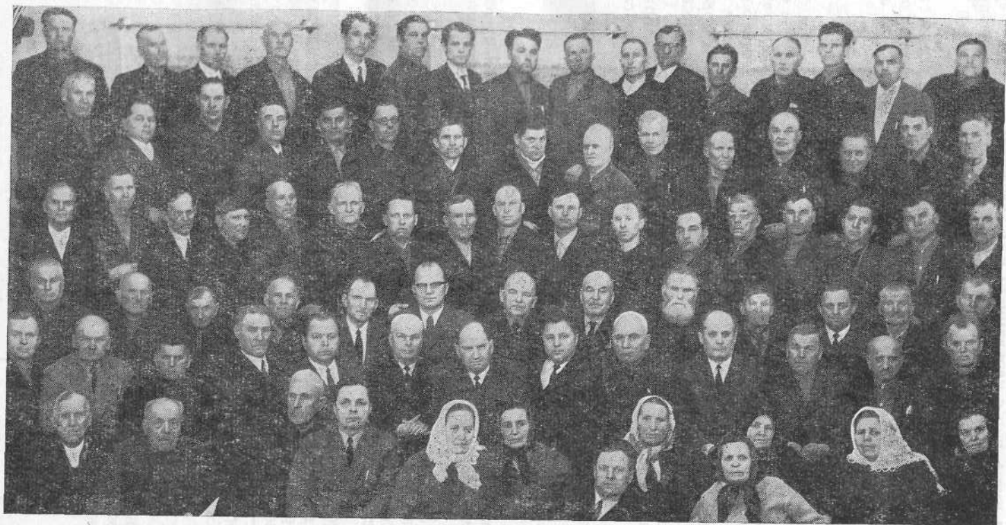
Участники областного пресвитерского совещания (г. Черкассы)