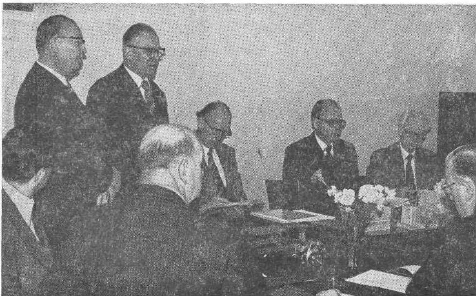
Заседание Исполкома Европейской баптистской федерации. Москва, март, 1976 г.

условии примирения. Поэтому баптисты Запада и Востока прилагают совместные усилия для созидания нового мира через Иисуса Христа».