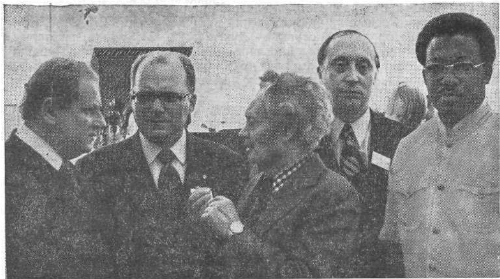
Руководящие братья ВСЕХБ вместе с зарубежными гостями.