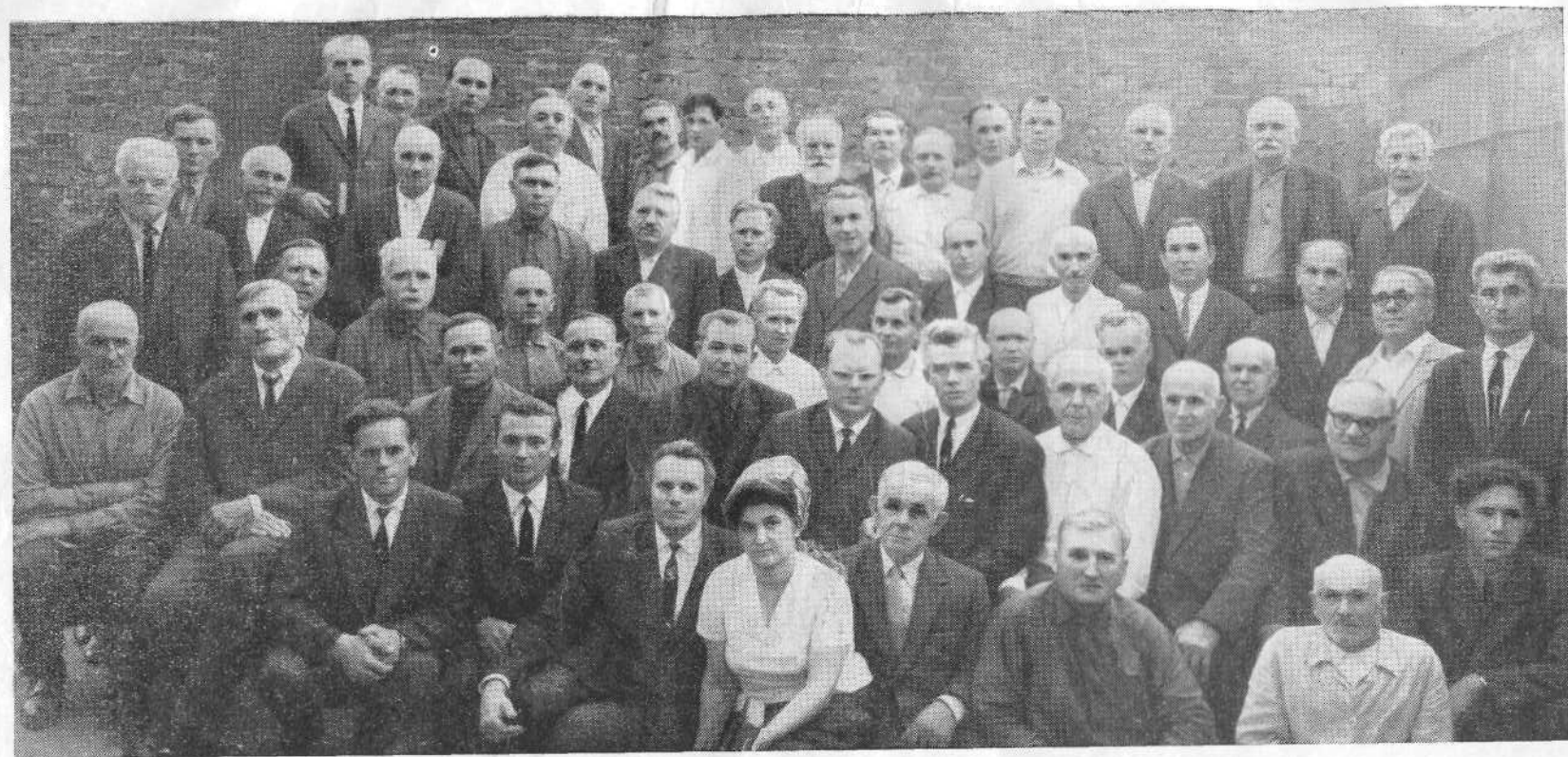
Республиканское совещание представителей церквей ЕХБ в Орджоникидзе