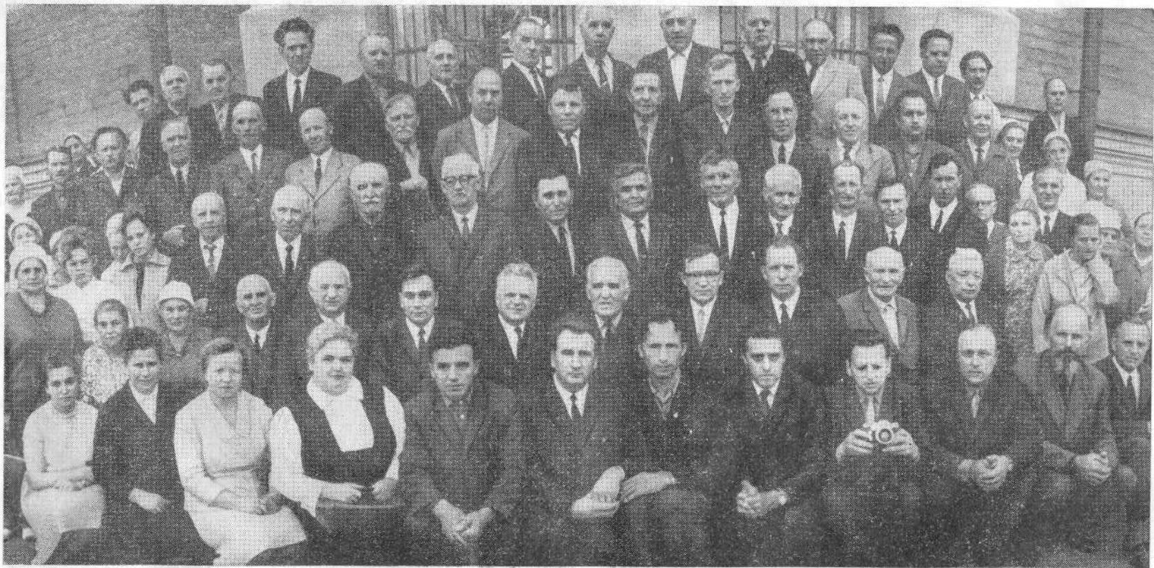
Межобластное совещание представителей церквей ЕХБ в Ленинграде