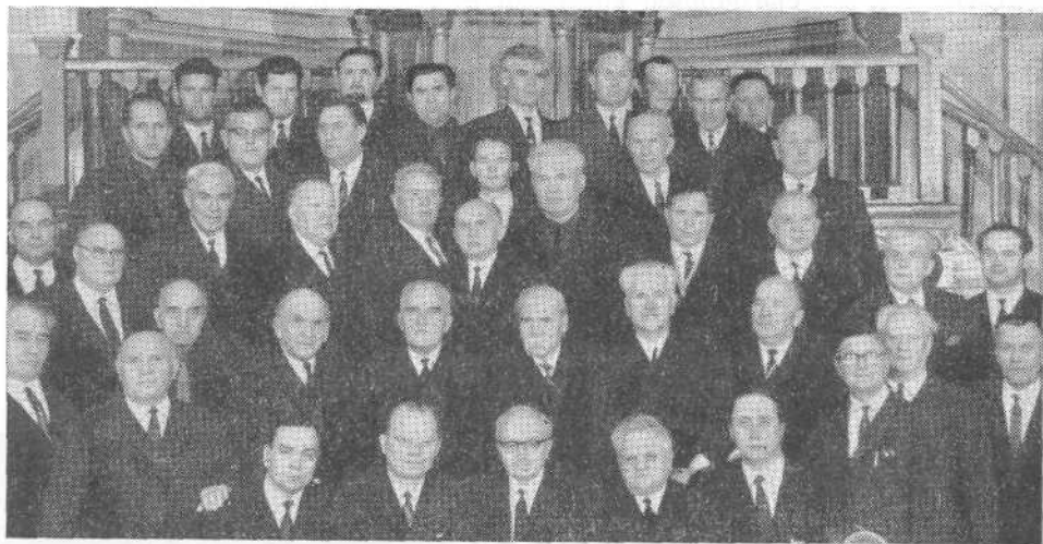
Участники Пленума ВСЕХБ 1970 г.