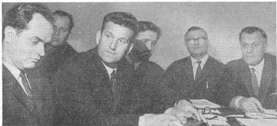
Рабочий момент Пленума ВСЕХБ

Как уже было сказано, наше братство отметило в текущем году 25-летие единства евангельских христиан-баптистов с христианами веры евангельской (пятидесятниками), и почти 25-летие единства с христианами в духе апостольском.