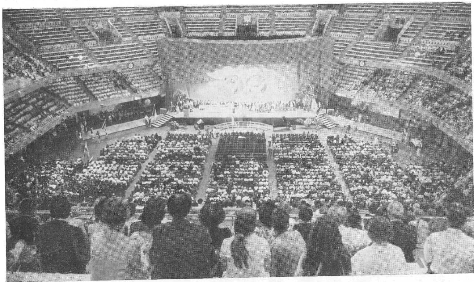
Будокан — зал заседаний Двенадцатого Всемирного Конгресса баптистов в Токио