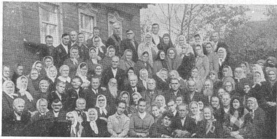
Верующие Сызранской церкви

«В доме Отца моего обителей много. И когда пойду и приготовлю вам место, приду опять и возьму вас к Себе, чтобы и вы были, где Я» (Ев. Иоан. 14 гл.) Ищите горнего, где Христос сидит одесную Бога» (Кол. 3 гл.). «Сие сказал Я вам, чтобы вы имели во Мне мир. В мире будете иметь скорбь, но мужайтесь: Я победил мир» (Ев. Иоан. 16 гл.).