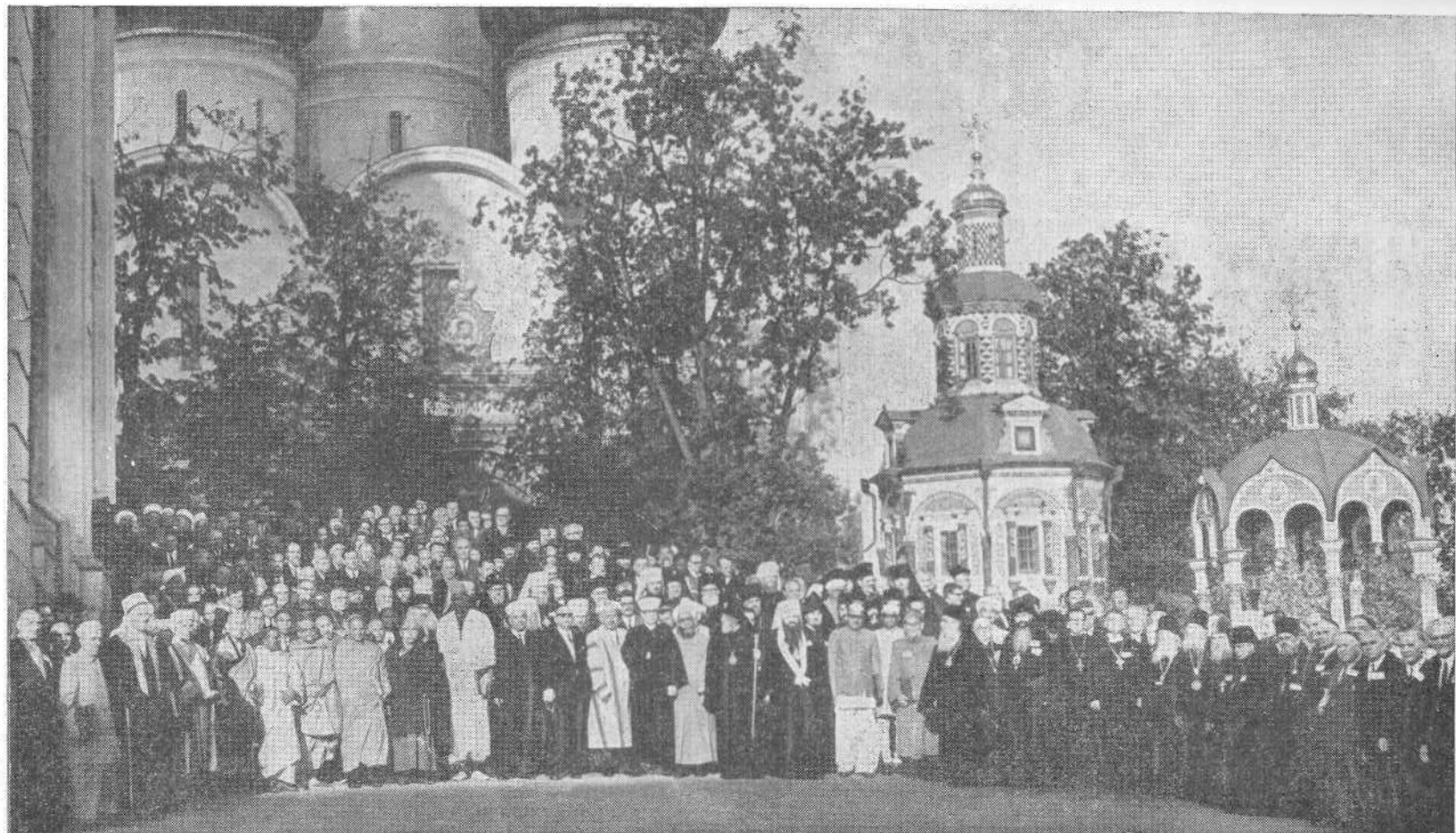
Участники Конференции представителей всех религий в СССР за сотрудничество и мир между народами