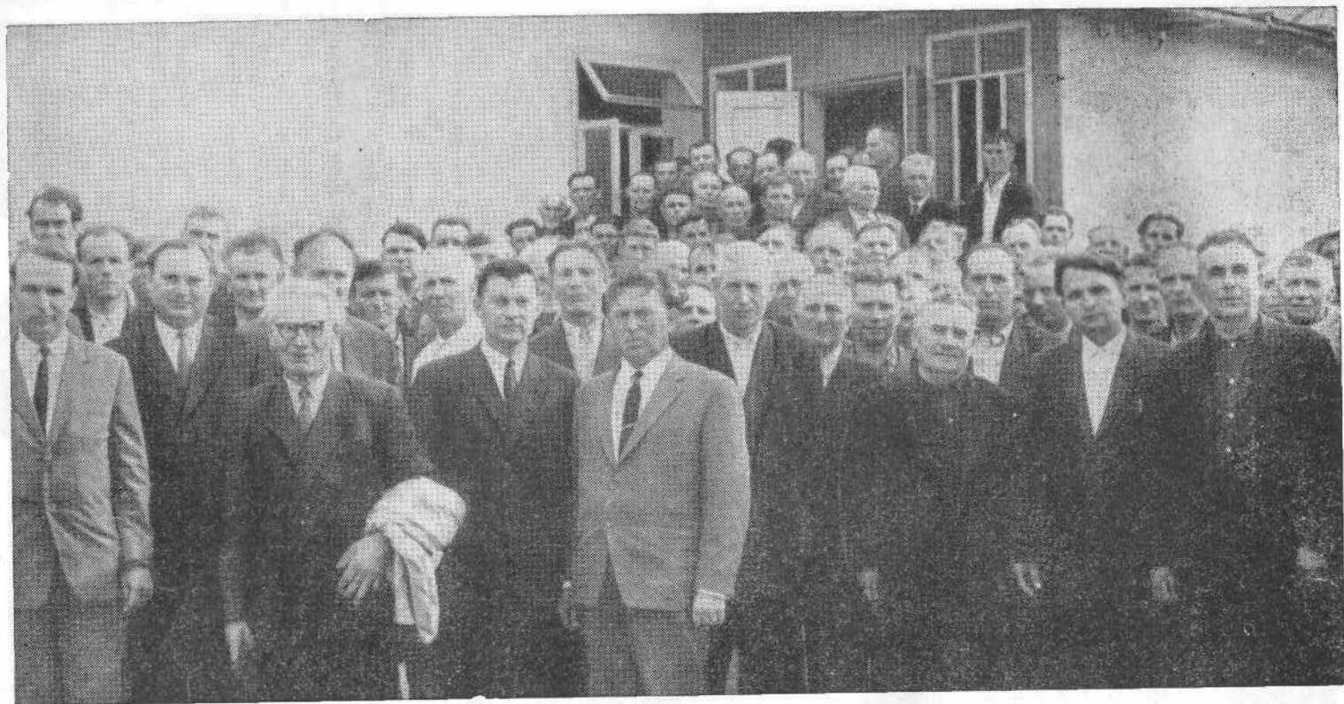
Участники Совещания представителей церквей ЕХБ Ровенской области