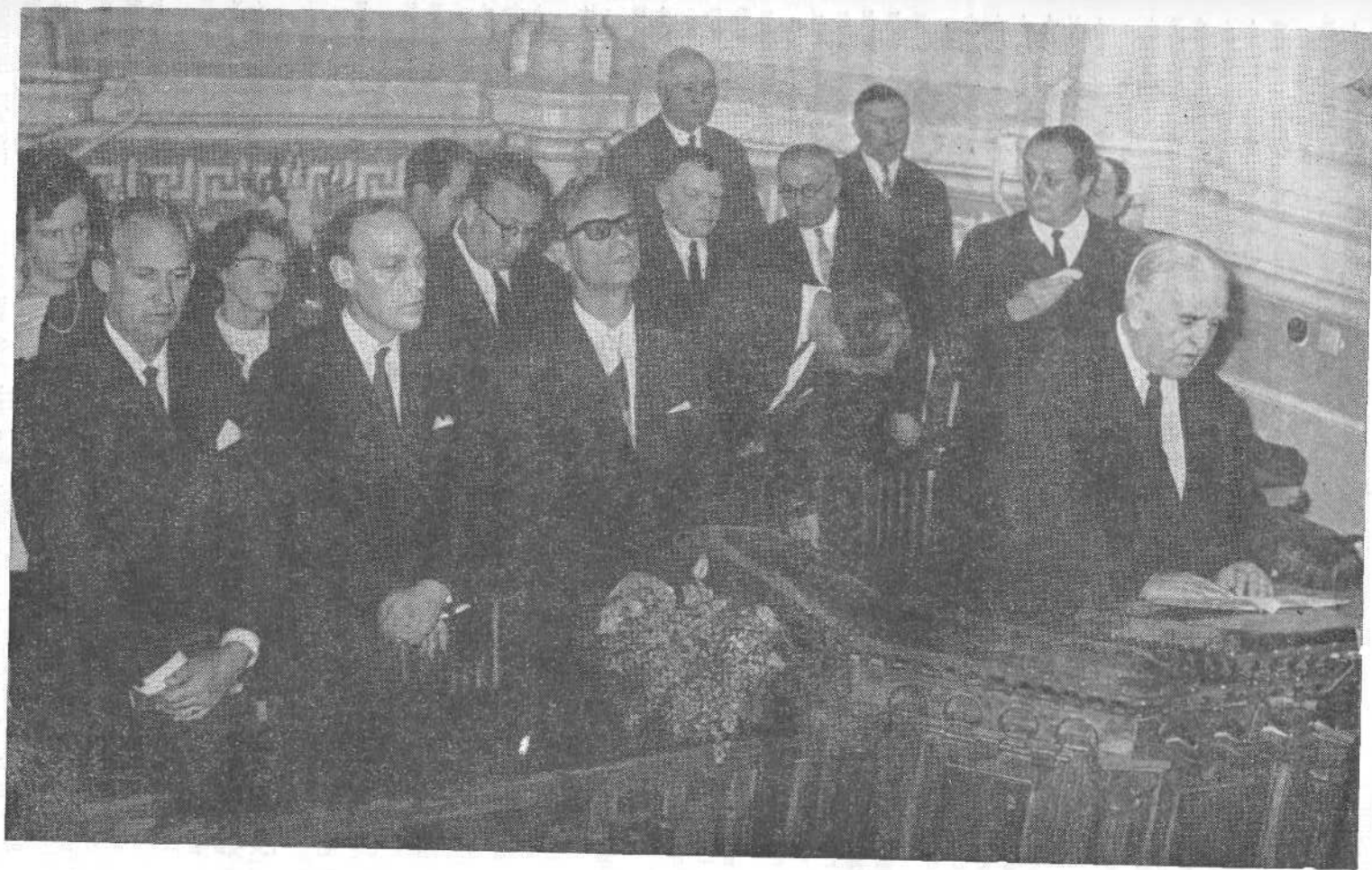
Делегация баптистов Швеции (слева) на богослужении Московской общины ЕВХ