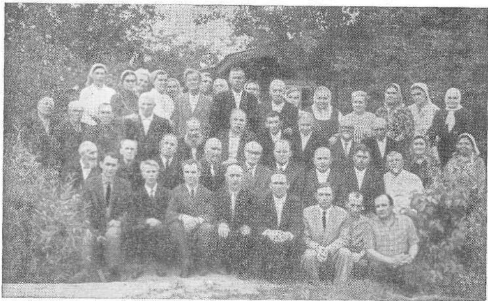
Межобластное Совещание представителей церквей ЕХБ в Калинин

ВСЕСОЮЗНЫЙ СОВЕТ ЕВАНГЕЛЬСКИХ ХРИСТИАН-БАПТИСТОВ