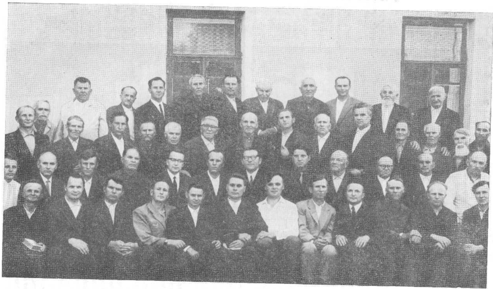
Участники Совещания представителей церквей ЕХБ Брянской области