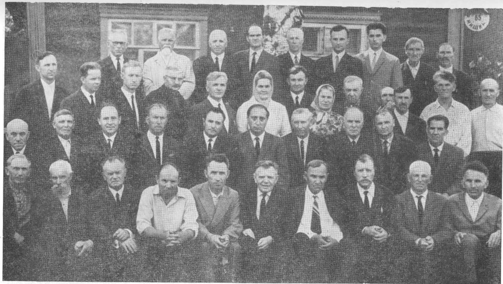
Межобластное Совещание представителей церкви ЕХБ в Серпухове