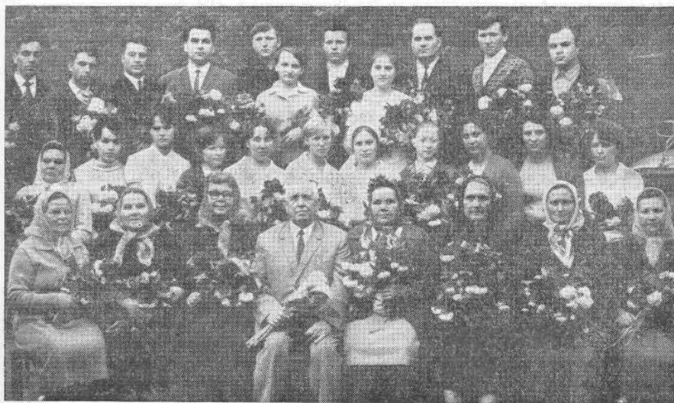
Группа крещаемых центральной Киевской церкви ЕХБ