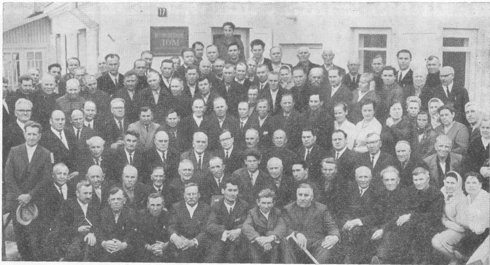
Участники республиканского Сопещания представителей церквей ЕХБ Белоруссии