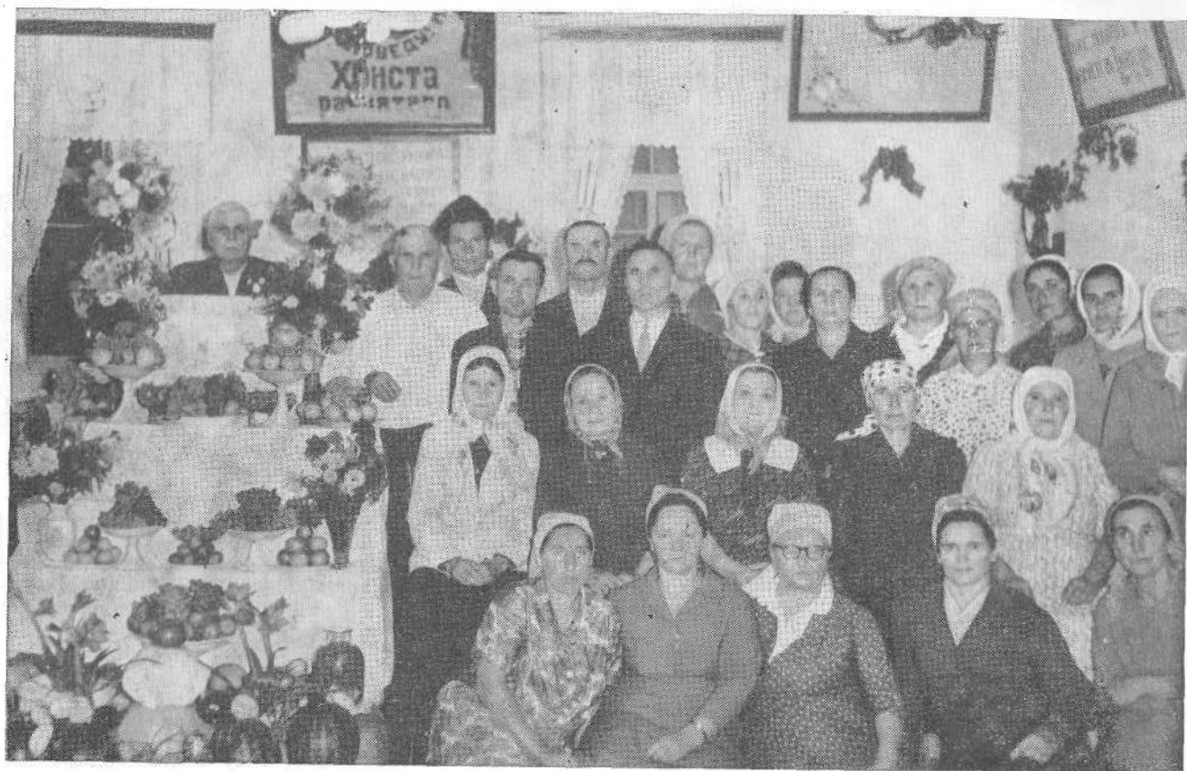
Праздник Жатвы в Сакской церкви