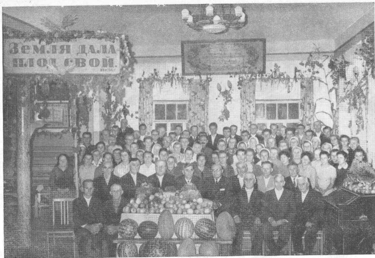
Праздник Жатвы в Джамбулской церкви