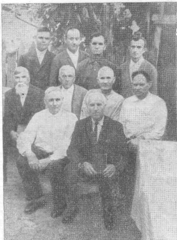
Служители Тираспольской церкви

Всесоюзный Совет евангельских христиан-баптистов