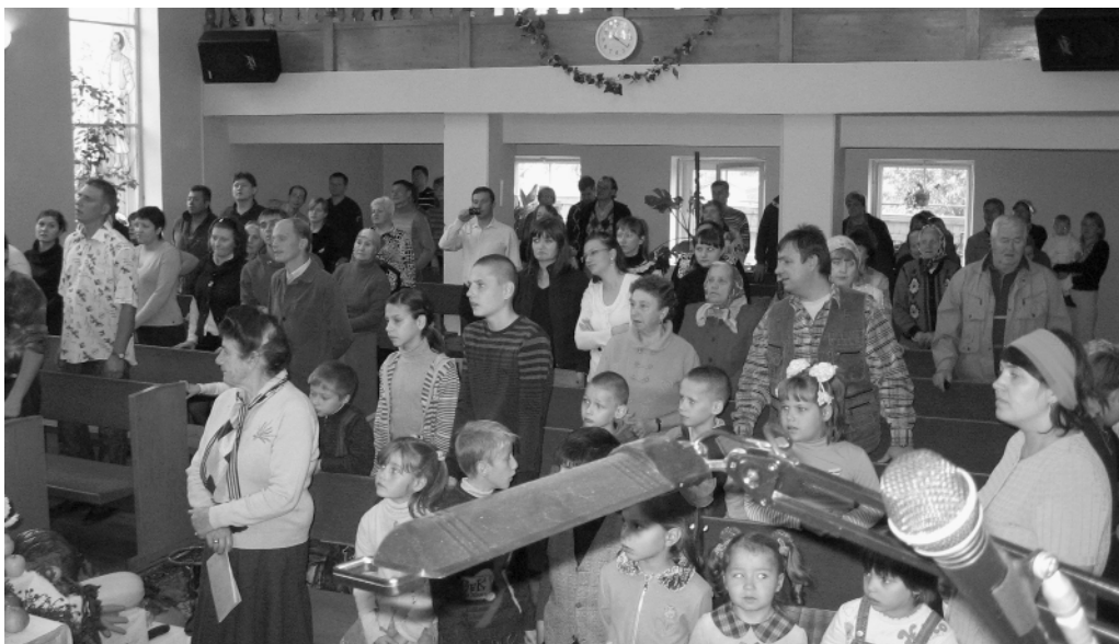
Верующие церкви г. Клина на богослужении

Особенно сильно звучали свидетельства той части молодежи, которых Бог спас как от духовной смерти, так и от смерти физической, так как некоторые из них получили спасение и новую жизнь, будучи на