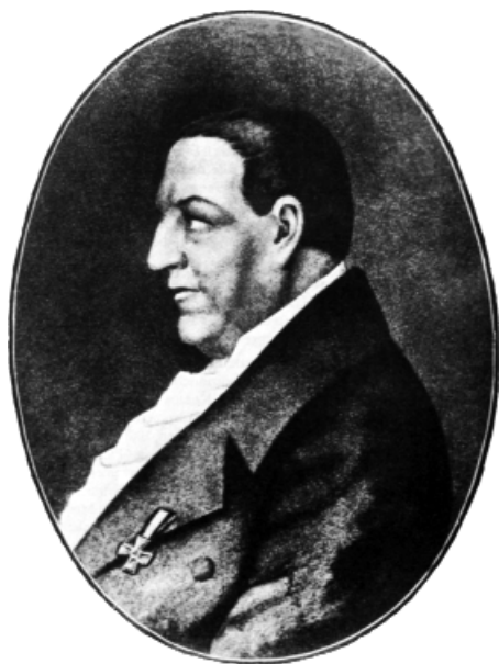
Ф. П. Гааз

Предавшись заботе об участии арестантов с неиссякающей любовью и неустанной энергией,