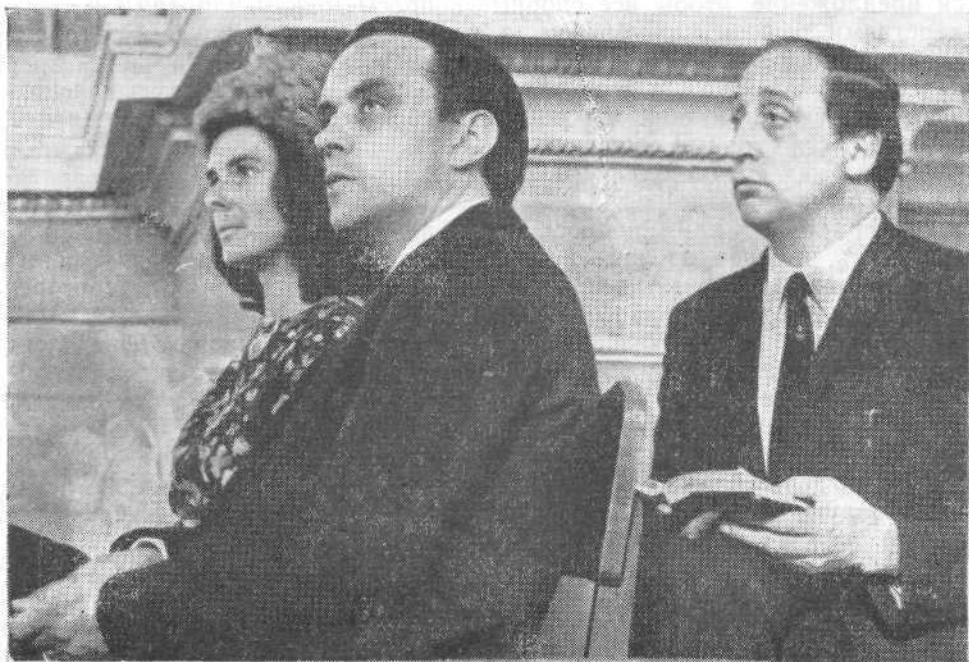
Президент Европейской Баптистской Федерации А. Макрей с супругой на богослужении Московской церкви