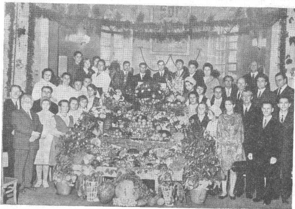
Праздник Жатвы в Ленинградской церкви. На снимке — руководство общины и часть хора

Библия на вид может быть невзрачна и многими людьми считается