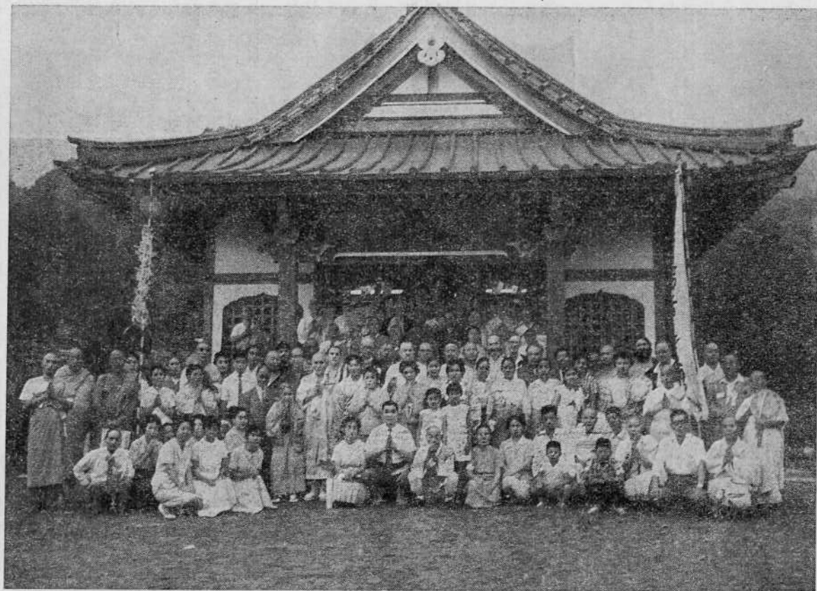
Делегаты Всемирной религиозной конференции у храма в городе Никко, Япония