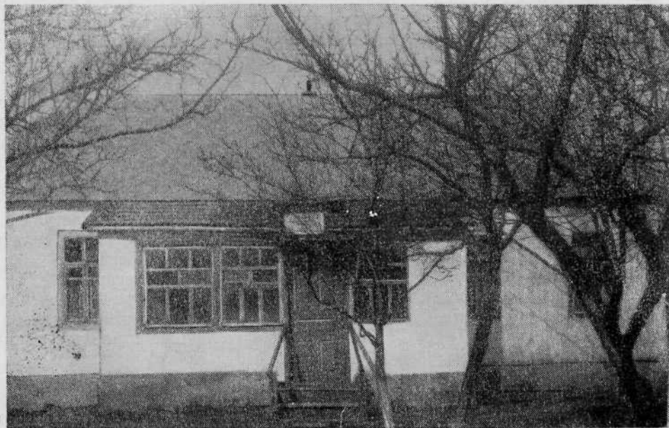
Молитвенный дом Константиновской общины евангельских христиан-баптистов, Донецкая область